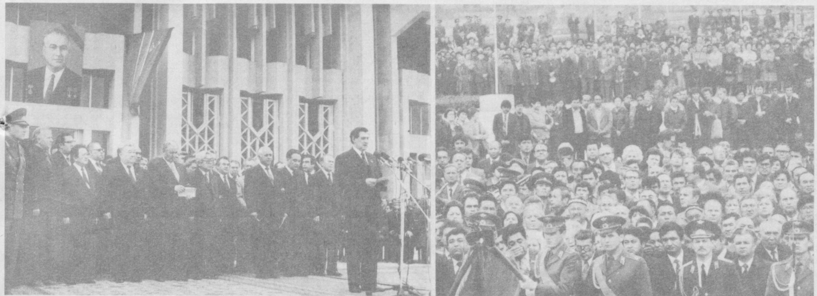
Ш. Р. Рашидов хотирасига бағишлаган мотам митинги.