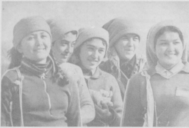
«Халқлар дўстлиги» орденли Тошкент политехника институтининг студентлари Дўстлик районидagi Ленин номили совхозда пахта йиғим-термида фидокорона шитроқ этиб, республиканинг улкан хирмониға муносиб ҳисса қўшишмоқда.