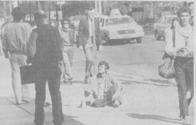
АҚШ. Мана бу ишсиз америкалик очлиг нималигини аъши била-ди. У кун буйи Нью-Йоркнинг серкатино кўчаларини кезиб, ку-лидик ҳэтиёбининг қондирш учун тинчликчи қилишға мажбур.

МАДРИД. Сальва-дор режими қотил-лари Сан-Николас Кантони аҳолисини «тинчтиш» юзаси-дан ўтказган опера-ция натижасида 177 киши ҳалок бўлди. Сальвадор ватанпар-вар кўчлари «Фара-бундо Марти» радио-станциясининг хабар беришича, ҳарбий-ҳо-мо кучларининг само-летлари аввало Кан-тонининг аҳоли пункт-ларини бомбарди-рон қилди, сўнгра америкалик «масла-ҳатчилар» қўмағида тузилган «Атлакатль» батальонидаги қал-ласарлар райони «тозалашни» ниҳоя-сига етказдилар.