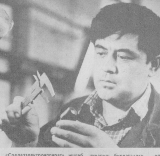
«Средствэлектронноапарат» ишлаб чиқариш бирлашмаси коллективини пойтахтнинг энг янги корхоналари қаторида мамлакат халқ хўжалиги ва экономикасини ривожлантириш ўн биринчи беш йиллик ланини бажаришда муносиб қўшмоқда. Беш йилликнинг марказий йилини юксак кўрсаткичларни кўлга киритиш билан зарбдорона яқунлаётган бирлашма ишчилари социалистик мусобақада фаол иштирок этишмоқда.

Кишилар асабига тегаётган бу камчилигини тўла-тўқис бартараф этишни хашарчиларга ҳам келтиришмайяпти. Шу тариха янгиободликлар тез-тез қоронғида ўтиришга мажбур бўлишмоқда. Энди бор умидимиз шаҳар электр тармоқлари корхонаси раҳбарларидан. Балки улар жонимизга аро киришарми? Кўпчилик номидан: Н. ОИХЎЖАЕВ.