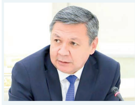
Шухрат ШАРАФУДИНОВ, Олий Мажлис Қонунчилик палатаси депутати, О'зЛиДеР фракцияси раҳбари уринбосари

Ривожланган мамлакатларда жамоат транспортлари ҳаракатланиш жадвалига қатъий амал қилинади. Шу боис уларнинг қатновига қараб соатни созлаш мумкинлиги айтилади.