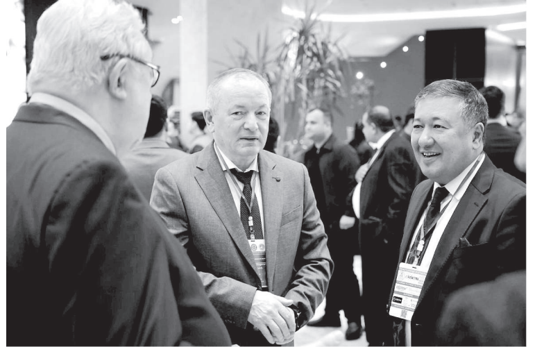
ташкил этилди. Ҳозирги пайтда Қўшма таълим факультетида 302 нафар талаба 6 та давлат

Ҳозирги кунда олий тиббий таълимни янада ривожлантириши мақсадида олий тиббий таълим муассасаларининг ўқув дастурларини жаҳон талаблари ва халқаро стандартларга мувофиқ қайта кўриб чиқиши, хорижий университетлар билан ҳамкорликда қўшма таълим дастурлари ва илмий изланишларни йўлга қўйиши, хорижий мутахассисларни жалб этиши ва миллий кадрларни халқаро тажриба билан таништириши, талабаларнинг амалий билимларини кучайтириши учун симуляцион марказлар ва клиник базаларни ташкил қилиши ва тиббиёт соҳасида илмий тадқиқотлар ва инновацион ечимларни қўллаб-қувватлаш каби устувор йўналишларда амалга оширилмоқда.