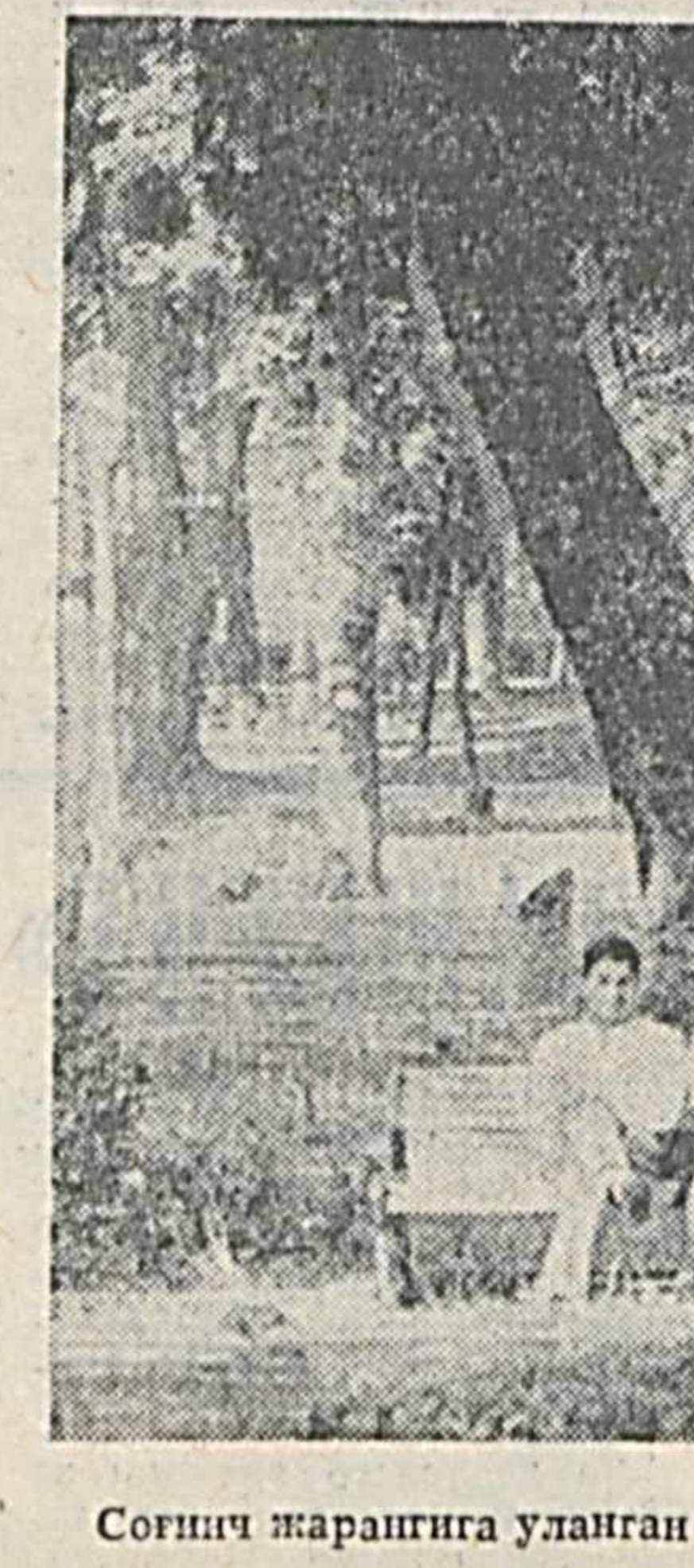
Сочиқ жаранга улган оилар...

ЭНГА: 1. Тўқимачилик, 6. Разведка, 8. Тожмаҳал, 11. Қанқар, 12. Байроқ, 13. Қочка, 16. Қасқад, 17. Қувват, 18. Автомобиль, 21. Электр, 22. Чирчи, 26. Сарбоз, 27. Сайрам, 28. Протон, 32. Абиссин, 33. Қарчига, 34. «Сарбодорлар».