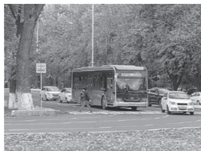
Тошкентда автобус ва метрода нақд пул шаклдаги ЙЎЛКИРА НАРХИ 3000 сўмга ошади.