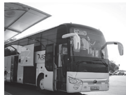
28 декабрдан 5 январгача ТОШКЕНТДАН ЧОРВОҚҚА мавсумий автобус қатнови йўлга қўйилди.