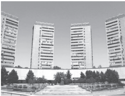
Хукумат қарорига кўра, кўп квартирали уйларни бошқариш органларининг ЭЛЕКТРОН РЕЕСТРИ юритилади.