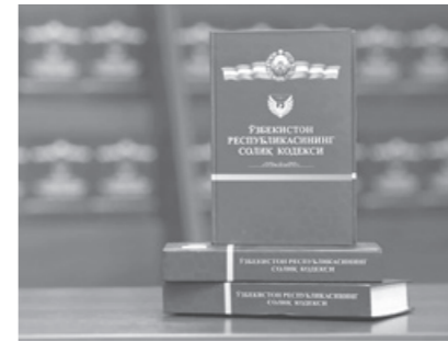
Янги қонун билан СОЛИҚ КОДЕКСИга ўзгартиришлар ва қўшимча киритилди.