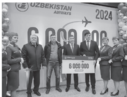
“Uzbekistan Airways” илк бор бир йил ҳисобида 6 МИЛЛИОН НАФАР йўловчи ташиди.