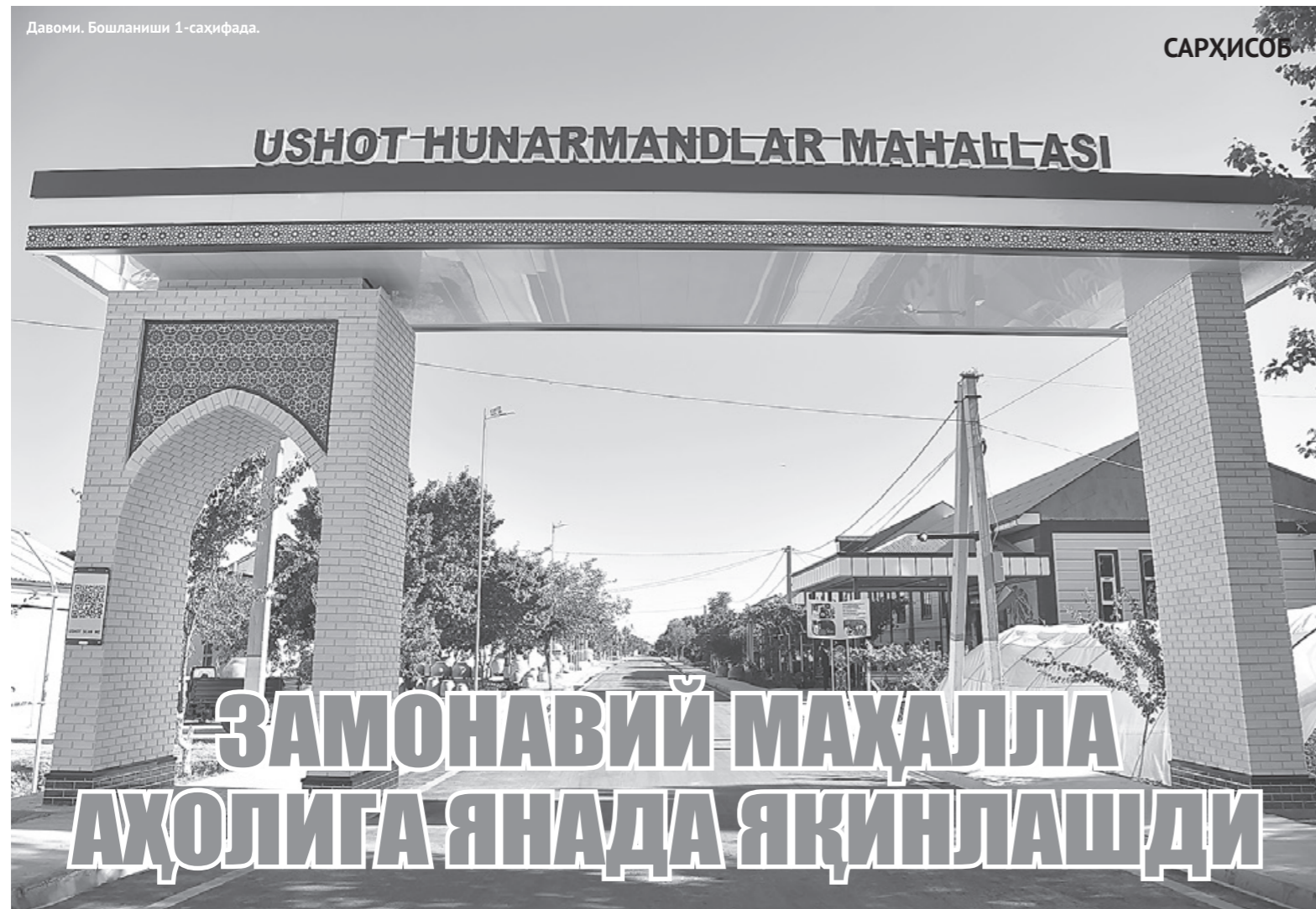
Давоми. Бошланиши 1-саҳифада.

Президент фармонига кўра, “Ягона интеграциялашган экотизим” АХБОРОТ ТИЗИМИ ишга туширилади.