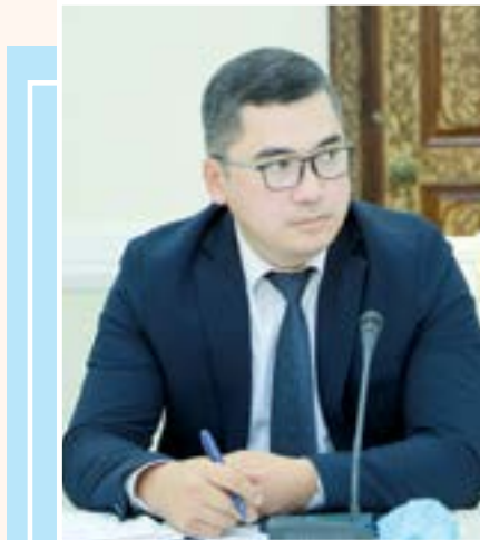
Farhod ZAYNIYEV, Oliy Majlis Qonunchilik palatasi deputati, iqtisodiyot fanlari bo'yicha falsafa doktori