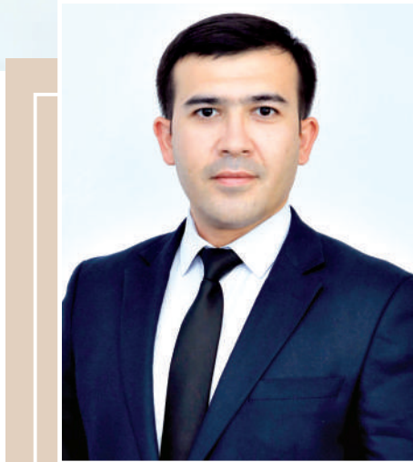
Статистика агентлиги томонидан МДХ Давлатлараро статистика қўмитаси билан ҳам яқиндан ҳамкорлик ва ўзаро маълумот

Доимий ўзгарувчан ахборот муҳитида миллий статистика идоралари фойдаланувчиларнинг ўзгарувчан эҳтиёжига мослашиб фаолият юритиши бугуннинг талабидир. Ушбу эҳтиёжлар қаноатлантирилишида халқаро услубиятлар ва бошқа мамлакатлар илғор тажрибасининг амалиётга жорий қилиниши маълумотлар сифатини оширади, уларга ишонч ортишига хизмат қилади. Бунда халқаро ҳамкорлик жуда муҳим ўрин тутати.