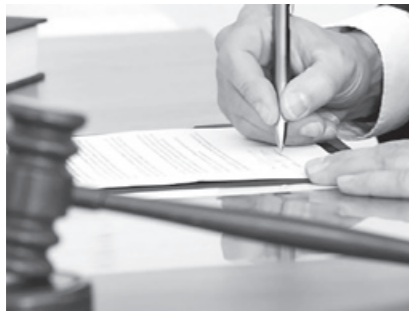
Президент "ДАВЛАТ СИРЛАРИ ТУГРИСИДА"ги қонунни имзолади.