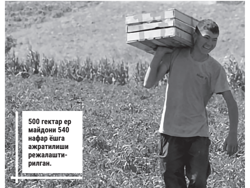
500 гектар ер майдони 540 нафар ёшга ажратилиши режалаштирилган.

Ёшларнинг хорижий тилларни ўрганишга бўлган иштиёқи юқори. Жумладан, 15 минг нафар ёш хорижий тилларга ўқитилди, камида В2 даражасини олиши таъминланди. IT марказларида 126 нафар ёш "Келажак касблари" лойиҳаси доирасида таълим олмақда. "Ибрат фарзандлари" лойиҳасида 5 минг 80 нафар ёш рўйхатдан ўтган бўлиб, 182 нафари тил билиш сертификатини қўлга киритди.