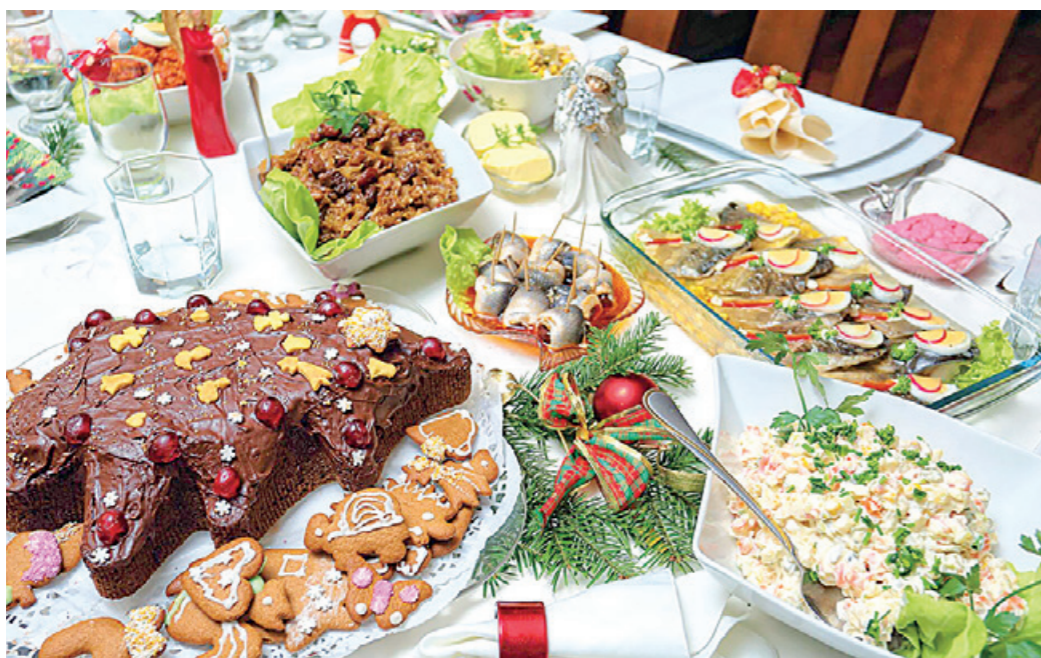
Қандай таом ёки егулик истеъмол қилишдан қатъи назар, тушликни бир стакан сув билан яқунлашга ҳаракат қилинг.

Байрамлар, туғилган кунлар, турли оилавий зиёфатлардан қолган мазали таом ва егуликларни кетма-кет, аралаш истеъмол қилиш организмга оғирлик қилади. Жигар, ошқозон, ичаклар ҳазм қилишга қийналади, уларнинг фаоллигида муаммолар кузатилиши мумкин.