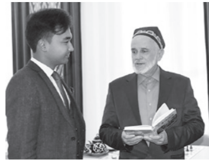
Ҳукумат қарори билан фаол нурунийларни камбағал оилаларга БИРИКТИРИШ ТАРТИБИ белгиланди.