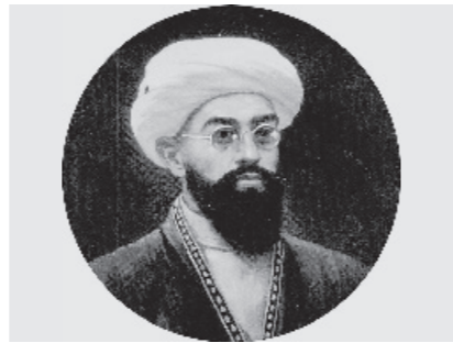
Президент қарорига кўра, МАҲМУДУЖА БЕХБУДИЙ таваллудининг 150 йиллиги кенг нишонланади.