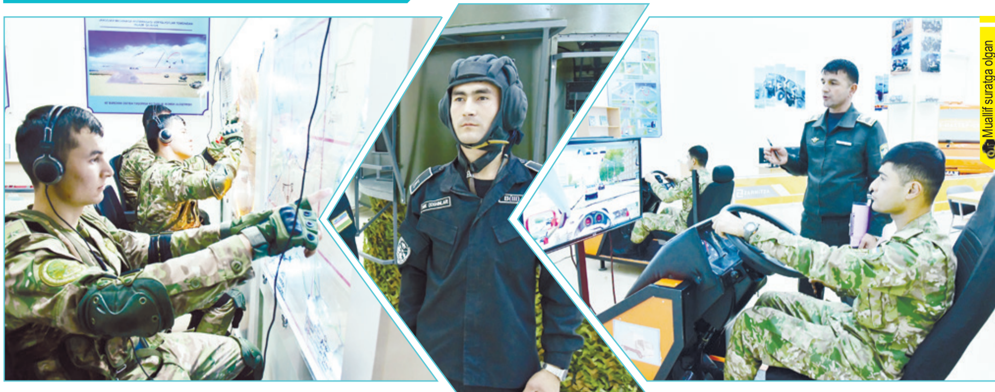
Muallif suratga olgan