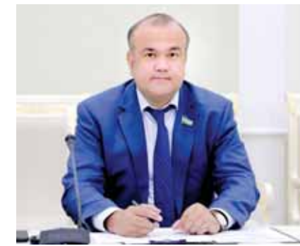
раҳбари Фармони билан қабул қилинган «Ўзбекистон — 2030» стратегияси ана шу мақсадга йўл очади.

Бугунги кунда мамлакатимиз аҳолиси йилга 2 фоиз ўсмоқда. Прогнозларга кўра, 2030 йилга бориб 40 миллионли мамлакат бўламиз. Бундай катта давлатда тинчлик ва барқарорликни сақлаш, халқимизга муносиб шароит яратиш учун иқтисодиёт ҳам, бошқарув ҳам, таълим ва тиббиёт ҳам янгилаш бўлиши, барча соҳада ўсиш, ривожланиш кузатилиши керак. Давлатимиз