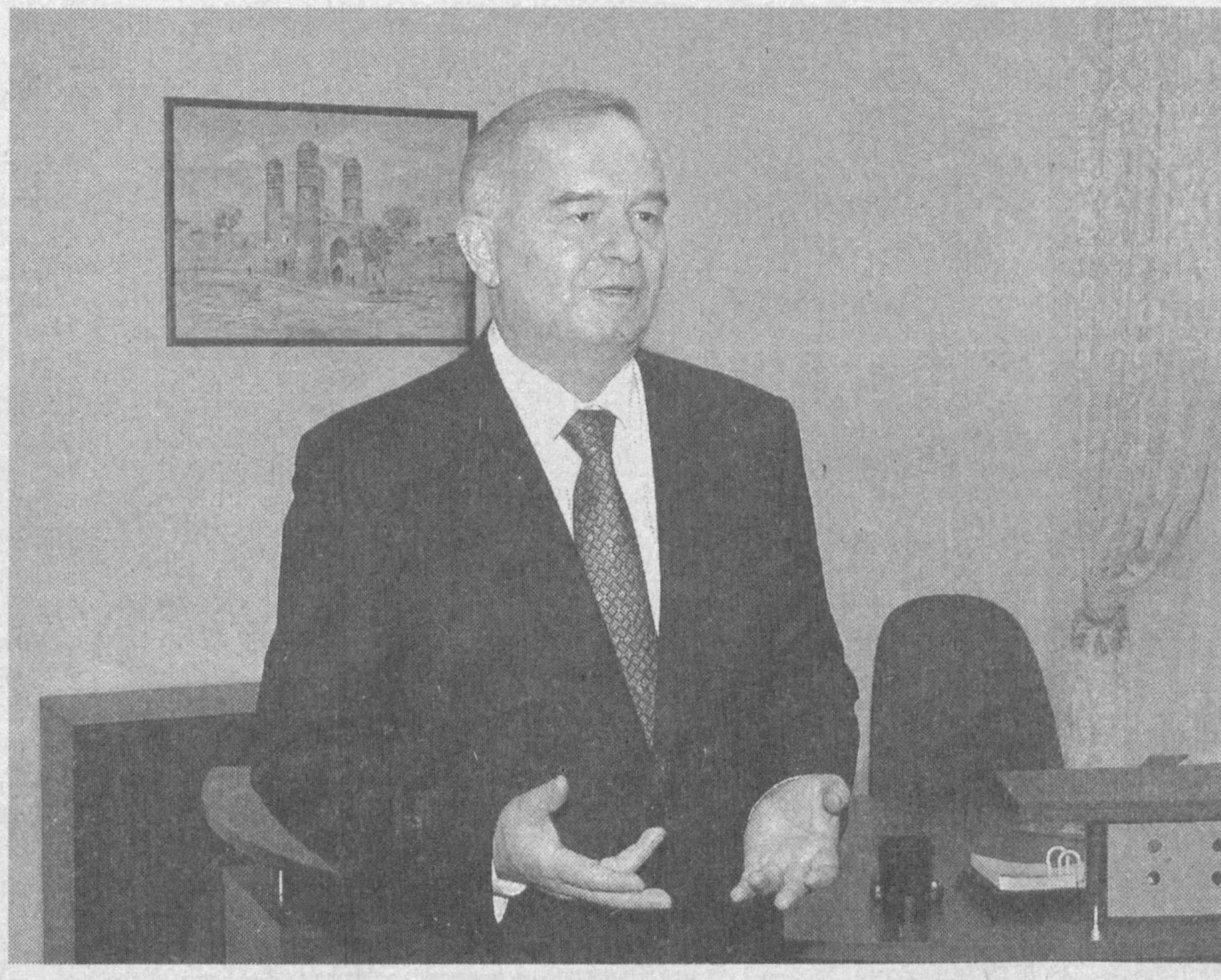
Президент тузилманинг мақсад ва вазифалари аниқ белгилаб қўйилганини таъкидлади. ШХТга аъзо давлатлар террорчиликка қарши кураш

Бу ерда муҳташам мажлислар зали, матбуот анжумани ва бошқа тадбирлар ўтказишга мўлжалланган зал, меҳмонхона мавжуд. Улар энг замонавий техника воситалари билан жиҳозланган.