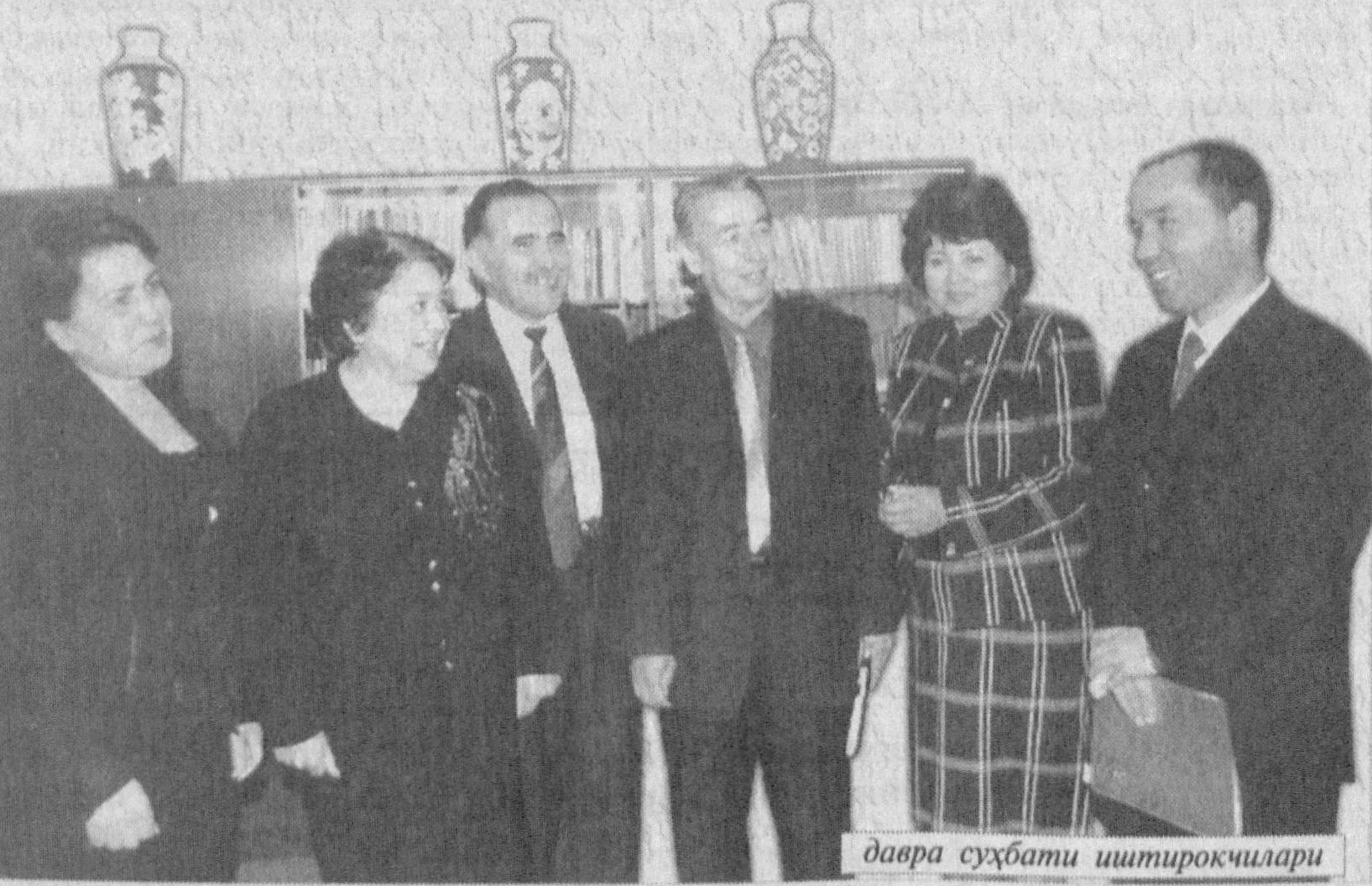
давра суҳбати иштирокчилари

Мамлакатимизда ҳар томонлама баркамол соғлом авлодни тарбиялаш ишлари изчиллик билан, янгидан-янги ташаббус ва чора-тадбирлар асосида олиб борилмоқда. Бунга қўйлаб мисоллар келтириш мумкин. Кейинги икки йилда эса болаларни спортга кенг жалб этиш, уларга шуғулланишлари учун етарли шароитлар яратишга катта эътибор берилмоқда.