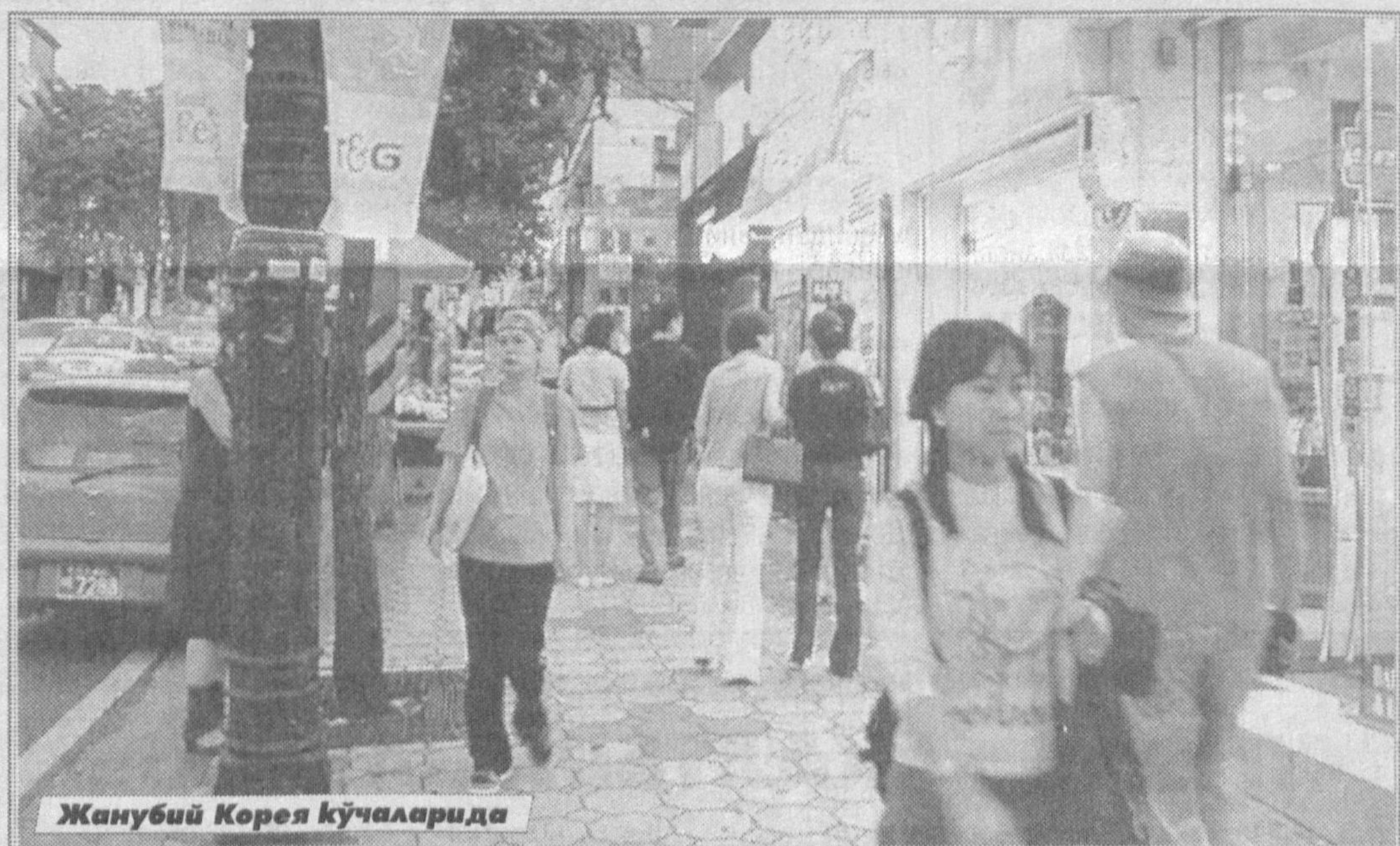
Жанубий Корея кўчаларида

Туғилиши мукофотлаш учун беш йилга ажратилган маблағ 19,2 миллиард Австралия доллари (13,33 миллиард АҚШ доллари) ташкил этади.