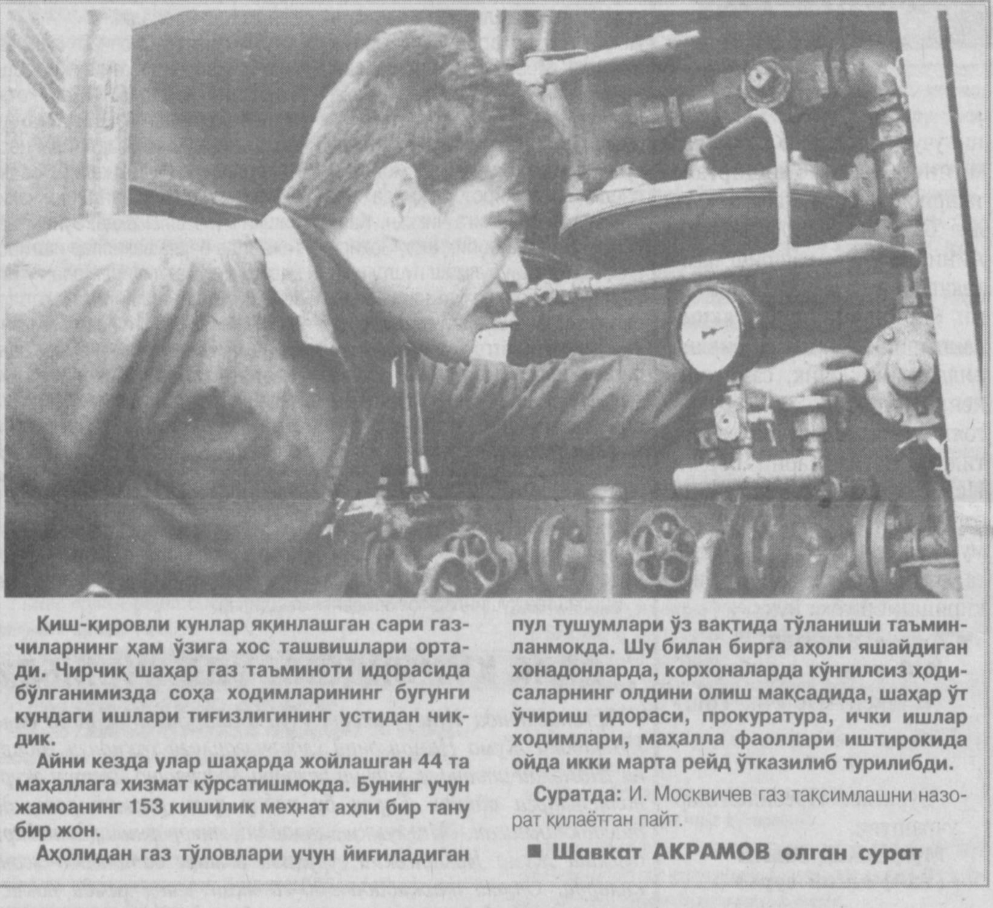
Киш-қировли кўнлар яқинлашган сари газ-чиларнинг ҳам ўзига хос ташвишлари орта-ди. Чирчиқ шаҳар газ таъминоти идорасида бўлганимизда соҳа ходимларининг бугунги кундаги ишлари тизилганининг устидан чиқ-ди.