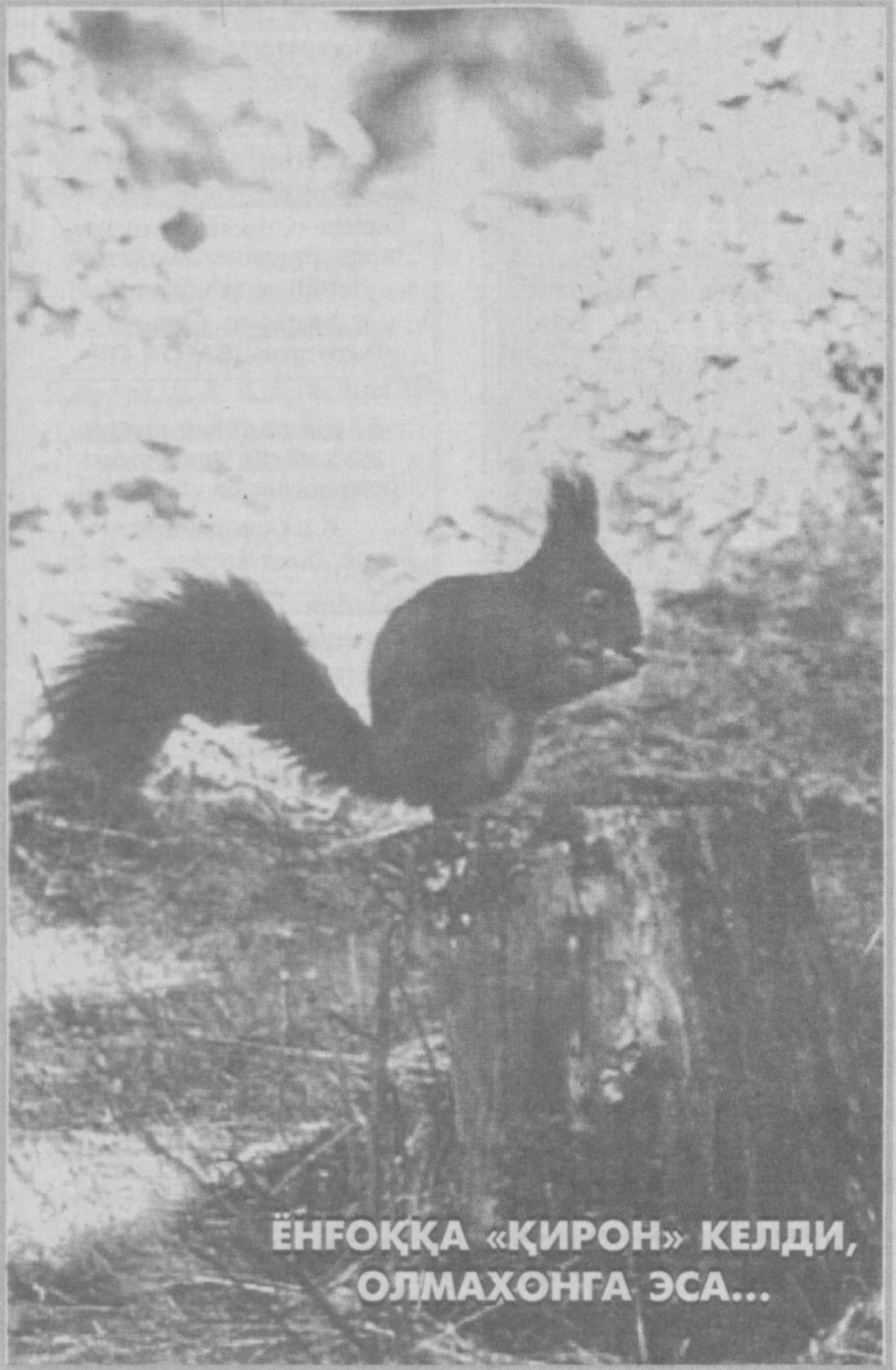
ЁНҒОҚҚА «ҚИРОН» КЕЛДИ, ОЛМАҲОНГА ЭСА...

2001 йил 21 декабрь кунлари КИМОСДА САВДОЛАРИНИ ЎТКАЗАДИ