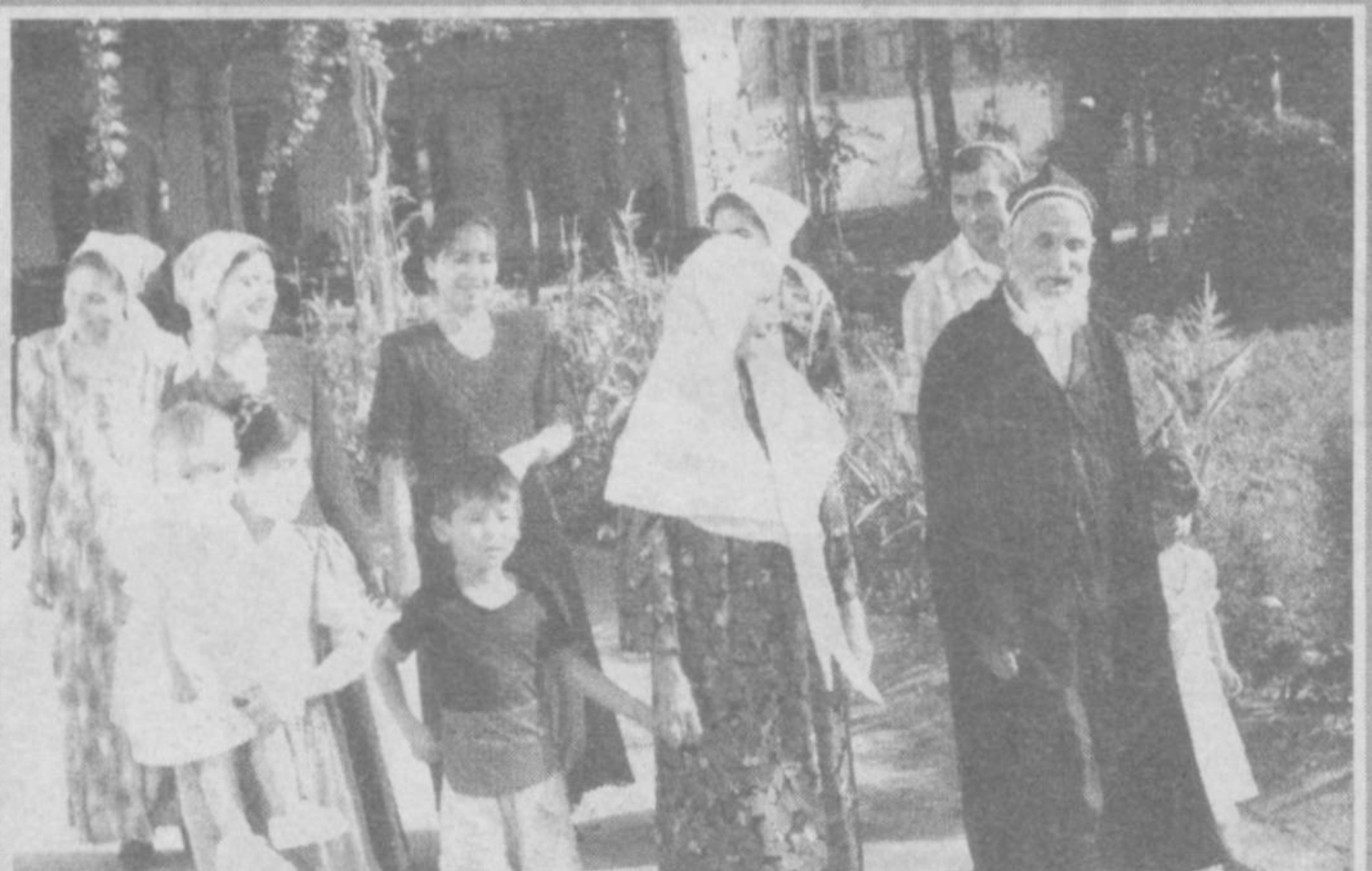
— Президентимиз ташаббуси билан кириб келаятган йилнинг «Қарияларни қадрлаш йили» деб эълон қилиниши биз кексаларга катта кўч бағишлади...