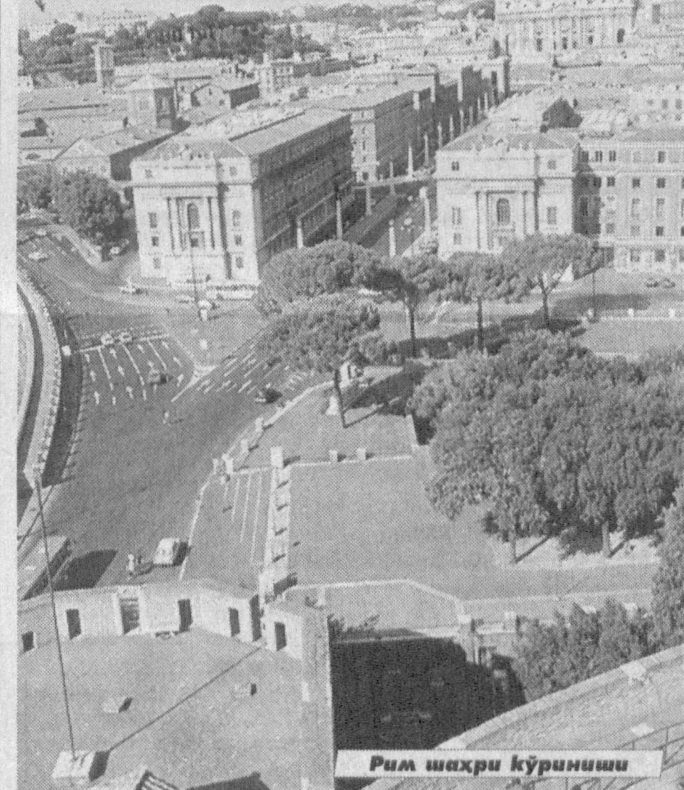
Рим шаҳри кўриниши

Музаффар ШАРОПОВ, «Ўзбекистон овози» муҳбири