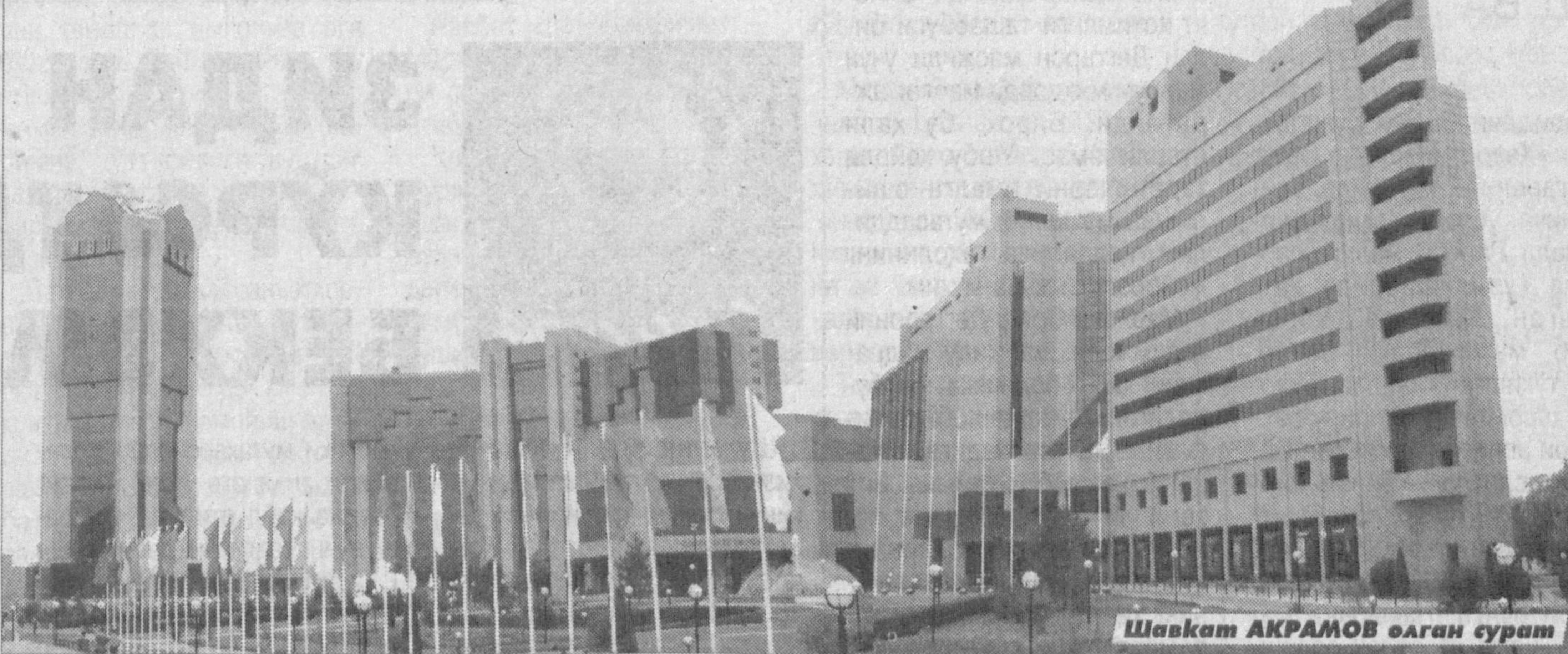
Шанхай АКРАМОВ олган сурат