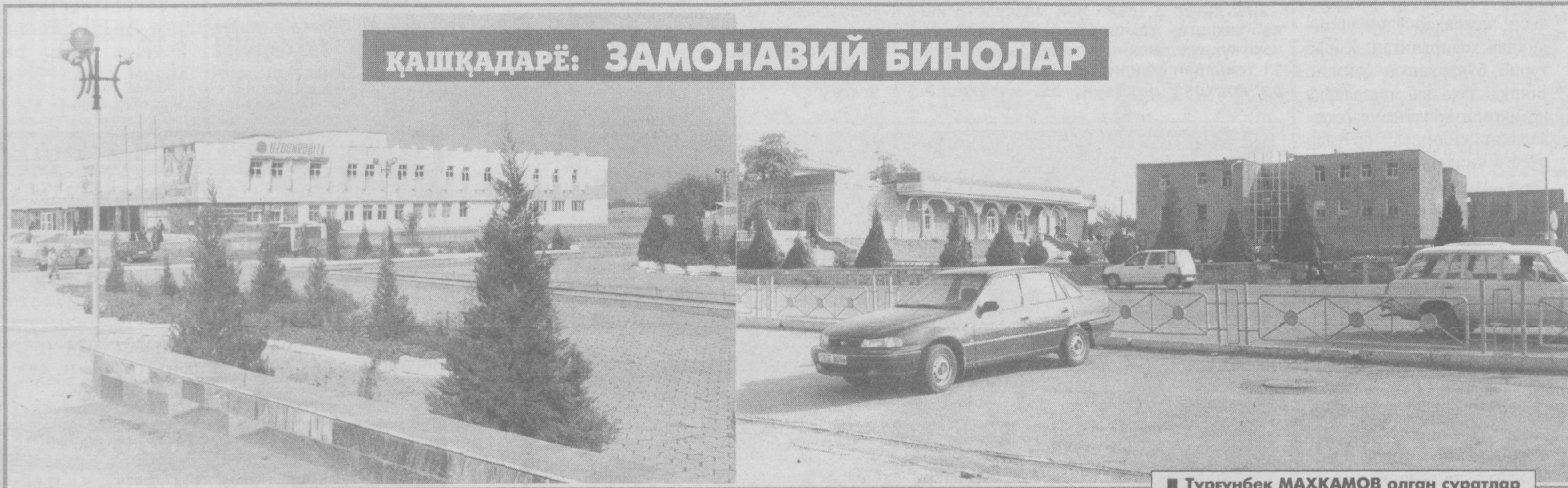
ҚАШҚАДАРЁ: ЗАМОНАВИЙ БИНОЛАР

Яқинда, шу йилнинг 18 декабрида Ўзбекистон Президенти Ислон Каримов БМТ Бош котиби Кофи Аннана Муржаатнома йўллаб, унда Афғонистонда юзга келган вазият ва шарт-шароитни ҳисобга олган ҳолда, ҳозирда тўпланиб қолган катта миқдордаги қурол-яроғни йиғиб олиш ва камайтиришга оид масалаларни ечиш заруратини баён қилган эди.