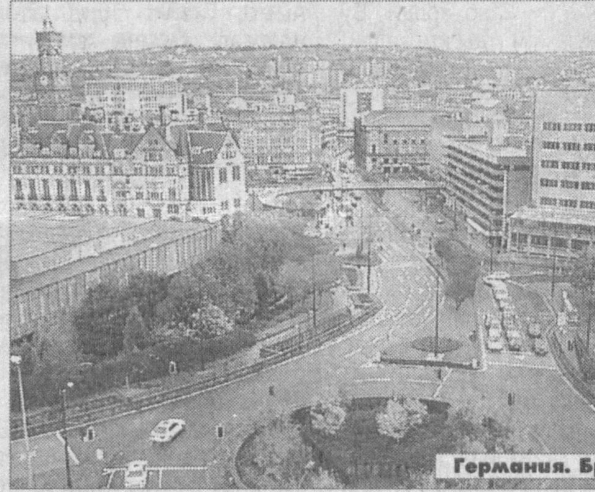
Германия. Бредфорд шаҳри кўриниши

Бу ҳақда «Новости» агентлиги хабар тарқатди.