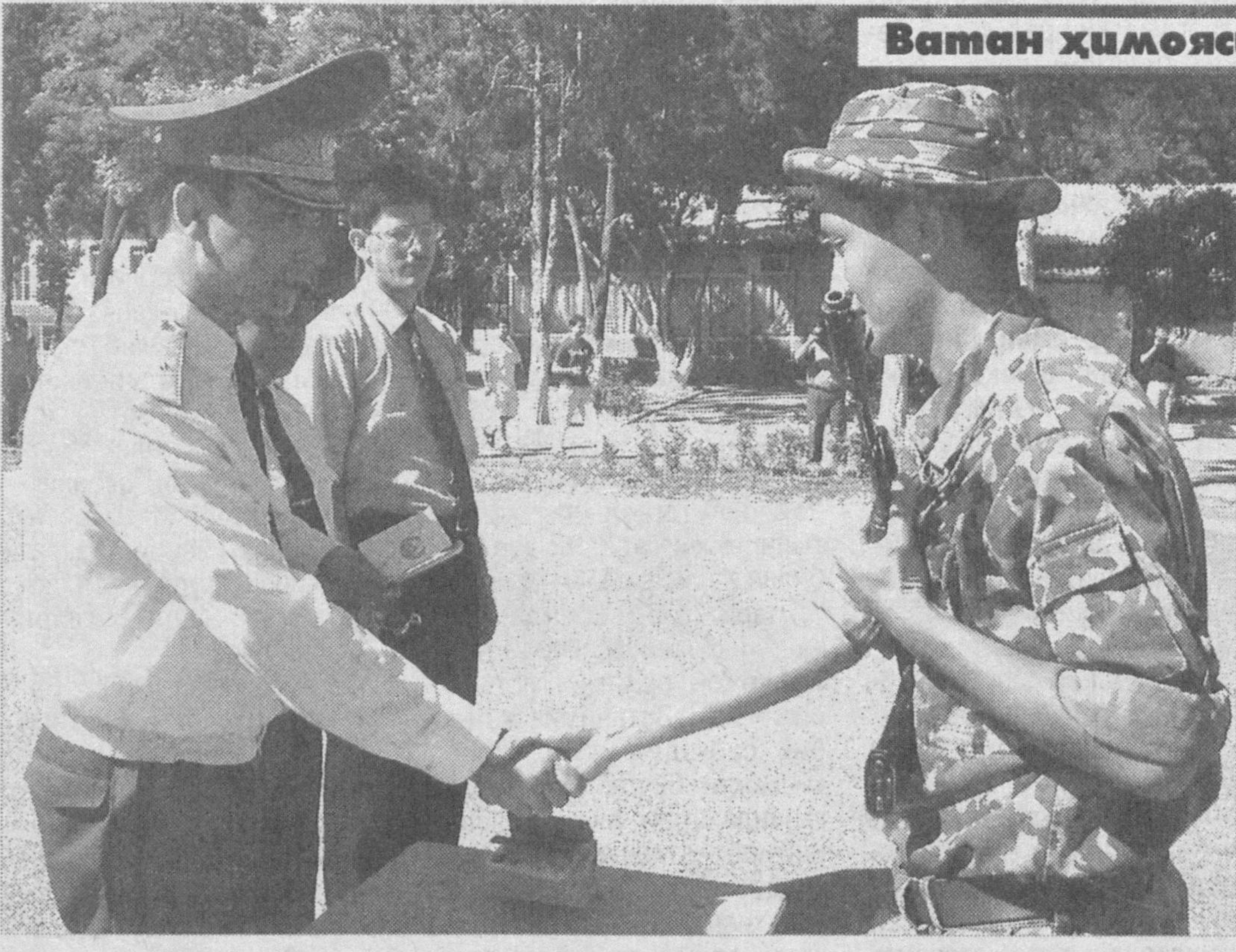
Ватан ҳимояси — олий шараф

қатми назар, Ўзбекистон Республикаси ҳудудиди фаолият олиб бораётган даврий нашрлардан бири, сайловолди ташвиқот даврида, Қонунчилик палатаси депутатлигига номзод ҳақида ахборот ёки маълумот берадиган бўлса, худди шундай микдорда ва ҳажмда тегишли округдаги бошқа номзодлар ҳақида ҳам нашрнинг келгуси сонларида ўша тартибда маълумот бериши назарда тутилмоқда.