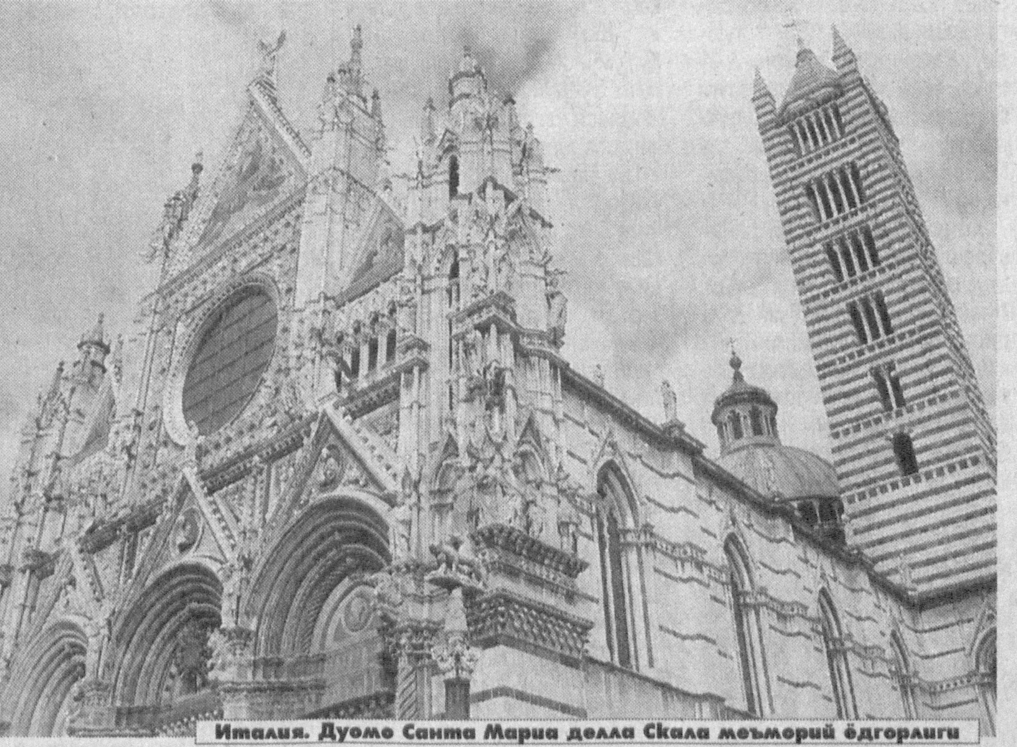
Италия. Дуомо Санта Мариа дела Скала мейморий ёдгорлиги

Яқинда Россия давлат думаси томонидан иккинчи ўқишда қабул қилинган «Маъмурий ҳуқуқбузарликлар тўғрисида»ги Кодексга киририлган ўзгаришлар анча қаттиққўллик билан ажралиб туради, — дея хабар беради ИТАР-ТАСС.