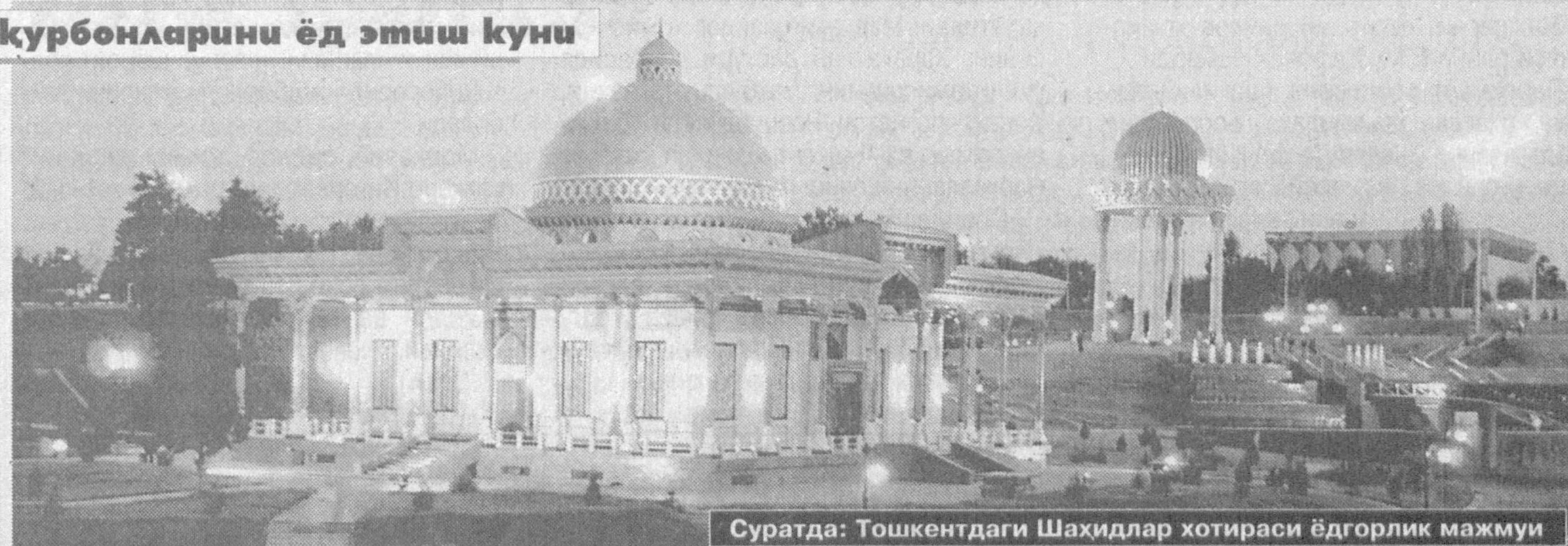
Суратда: Тошкентдаги Шаҳидлар хотираси ёдгорлик мажмуи