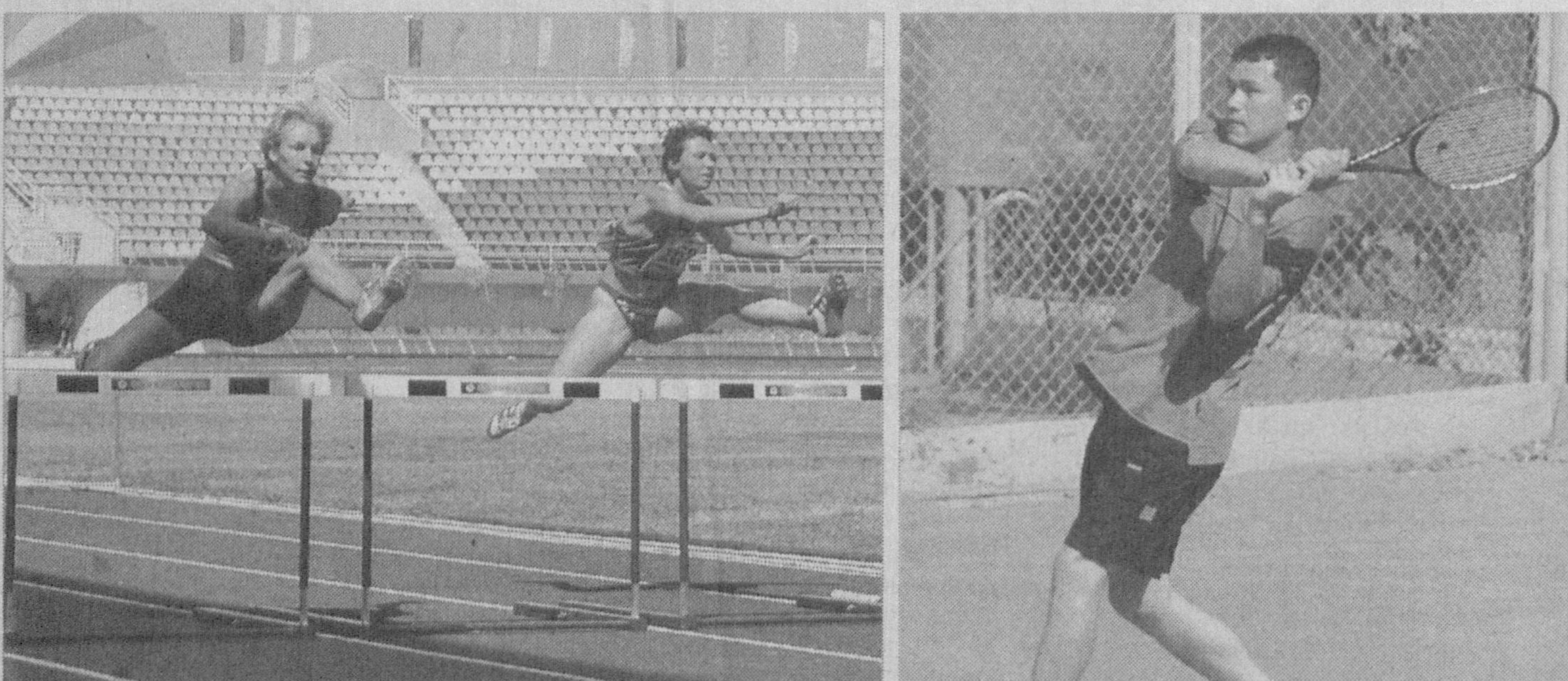
(Давоми. Боши 1-бетда.)

Кичик олимпиада, дея эътироф этилаётган универсиада бахслари аввалгиларидан бирмунча фарқ қилади.