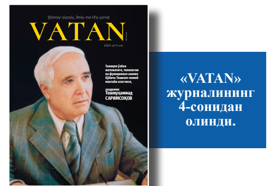
«VATAN» журнаlining 4-сонидан олindi.