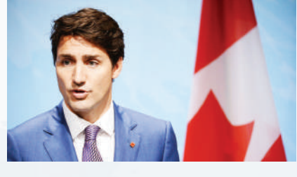
Таъкидлаш жоизки, Трюдо Канада ҳукуматида қарийб 10 йил, 2015 йил ноябрдан буён бошқариб келяпти. У ушбу лавозимда уч мuddат ишлади. Канада бош вазирлари орасида хали ҳеч қим қаторасига тўрт мuddат сайланмаган.

Канада бош вазири Жастин Трюдо Либерал партия миллий йиғилиши олтидан 8 январга қадар партия раҳбарлиги лавозимидан истеъфога чиқиши мумкин. Трюдонинг қачон истеъфога чиқиши маълум эмас. Ammo бу чор-шанба кuni бўлиб ўтгадиган миллий йиғилишдан олдин содир бўлиши кутуляпти.