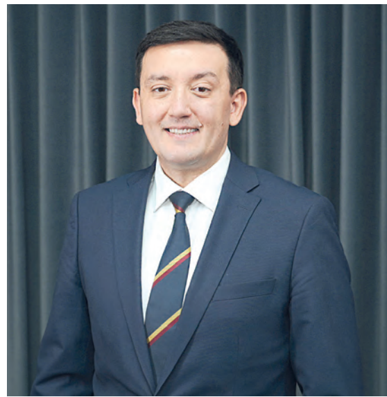
Бобур Бекмуродов. Председатель Комитета Законодательной палаты Олий Мажлиса Республики Узбекистан по вопросам предпринимательства, развития конкуренции и промышленности, председатель Движения «Ожусалиш».