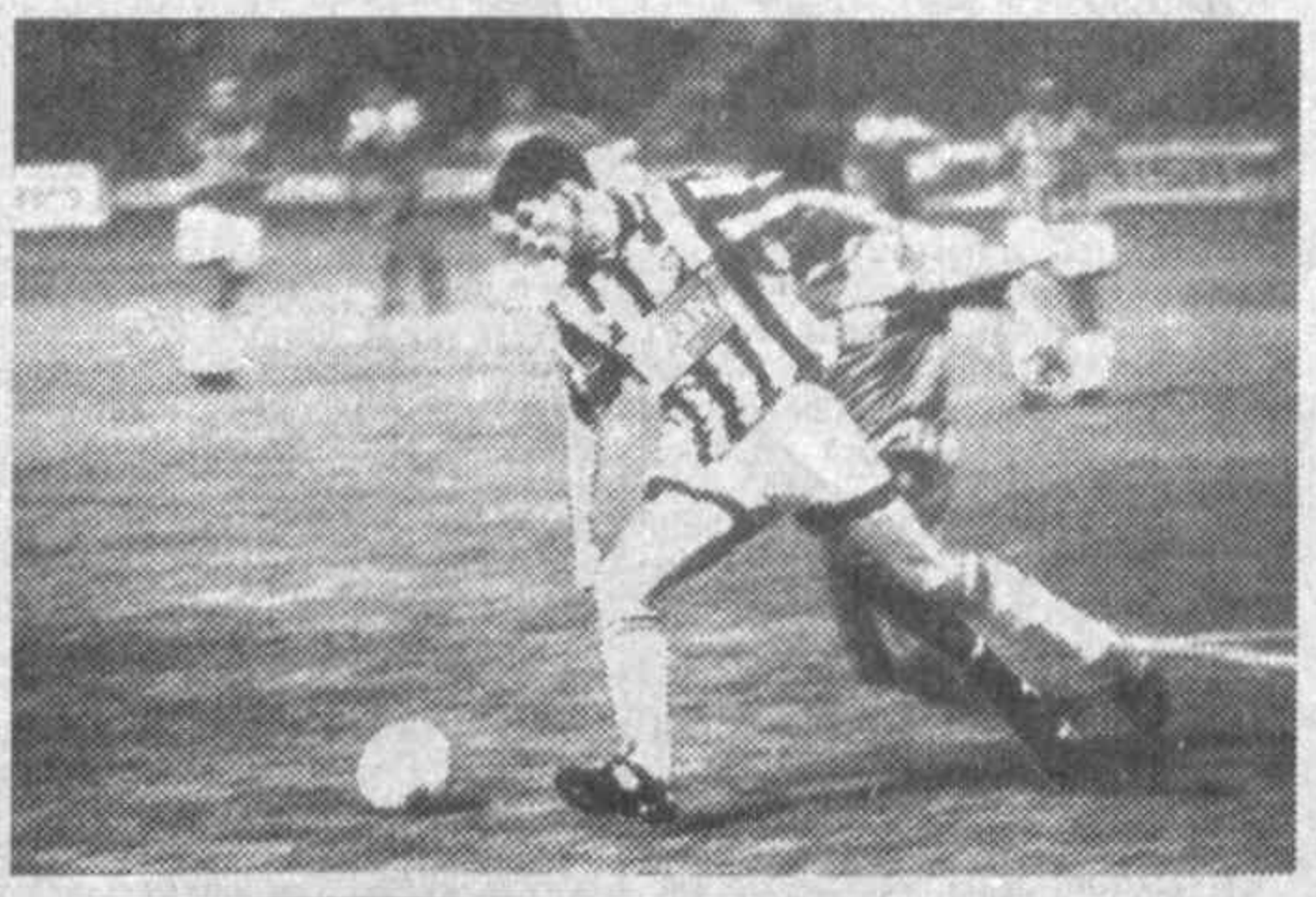
26 январь-3 февраль кунлари футбол бўйича Москвада МДХ мамлакатлари чемпионлигининг ананасовий турнири ўтказилди. Туртинчи марта ўтказилган ушбу турнирда юртимиз футбол шарафини Фарғонанин «Нефтчи» жамоаси ҳимоя қилди. Бу йилги турнирнинг мукофот жамғармаси 120 миң АҚШ долларига тенг. Ғолиба мукофот жамғармасининг 35 фоизи берилади.

Мутахассисларнинг фикрига қўра, «Нефтчи» учун қўра омадли бўлди. Юртдошларимиз финалгача «Динамо» (Киев), «Динамо» (Тбилиси), «Динамо» (Минск), «Жальгириси» (Вильнюс) каби машҳур командаларга дуч келмайдик. Агар жамоамиз «А» гуруҳи баҳсларида «Зимбру» (Кишинеў), «Сконтос» (Рига) «Түсифи»ни юз физиклик на-тижа билан ошиб ўтса, чорак финалда «В» гуруҳида иккинчи ўринни эгаллаган жамоага қарши ўйнайди. Бу гуруҳда «Спартак-Алания» (Владикавказ), «Пюник» (Ереван), «Елимай» (Семипалатинск), «Қант-Ойл» (Киргизистон) жамоалари ўзаро тўп суришади. Олдиндан башорат қилувчиларнинг фикрича, «Нефтчи»нинг чорак финалдаги рақибни Арманистоннинг «Пюник» жамоаси бўлиши кутуляпти. Агар юртдошларимиз бўтқиқдан ҳам ўтса, у ҳолда ярим финалда Миржалол Қосимовнинг жамоаси — «Спартак-Алания»