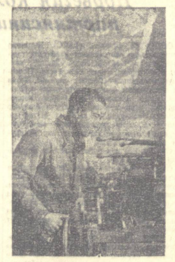
Пудлар министрлигига қарашли Тошкент машинасозлик заводига сайловчилик комиссиясининг аъзолари кўни сайин кенг ривожланишмоқда.