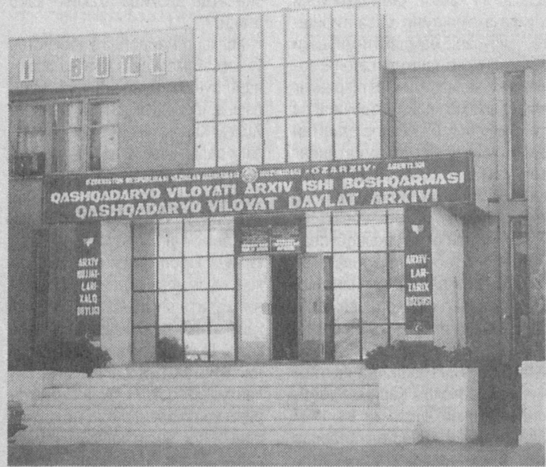
QASHQADARYO VILOYATI ARXIV ISH BOSHQARMASI QASHQADARYO VILOYAT DAVLAT ARXIVI

сус комиссия тузилган. Ўтган йиллар мобайнида мазкур комиссия фаол ишлаб келяпти. Шу пайтгача маълум бўлмаган қанча-қанча ҳужжатлар аниқлашиб, уларнинг муайян қисми келтирилди ҳам.