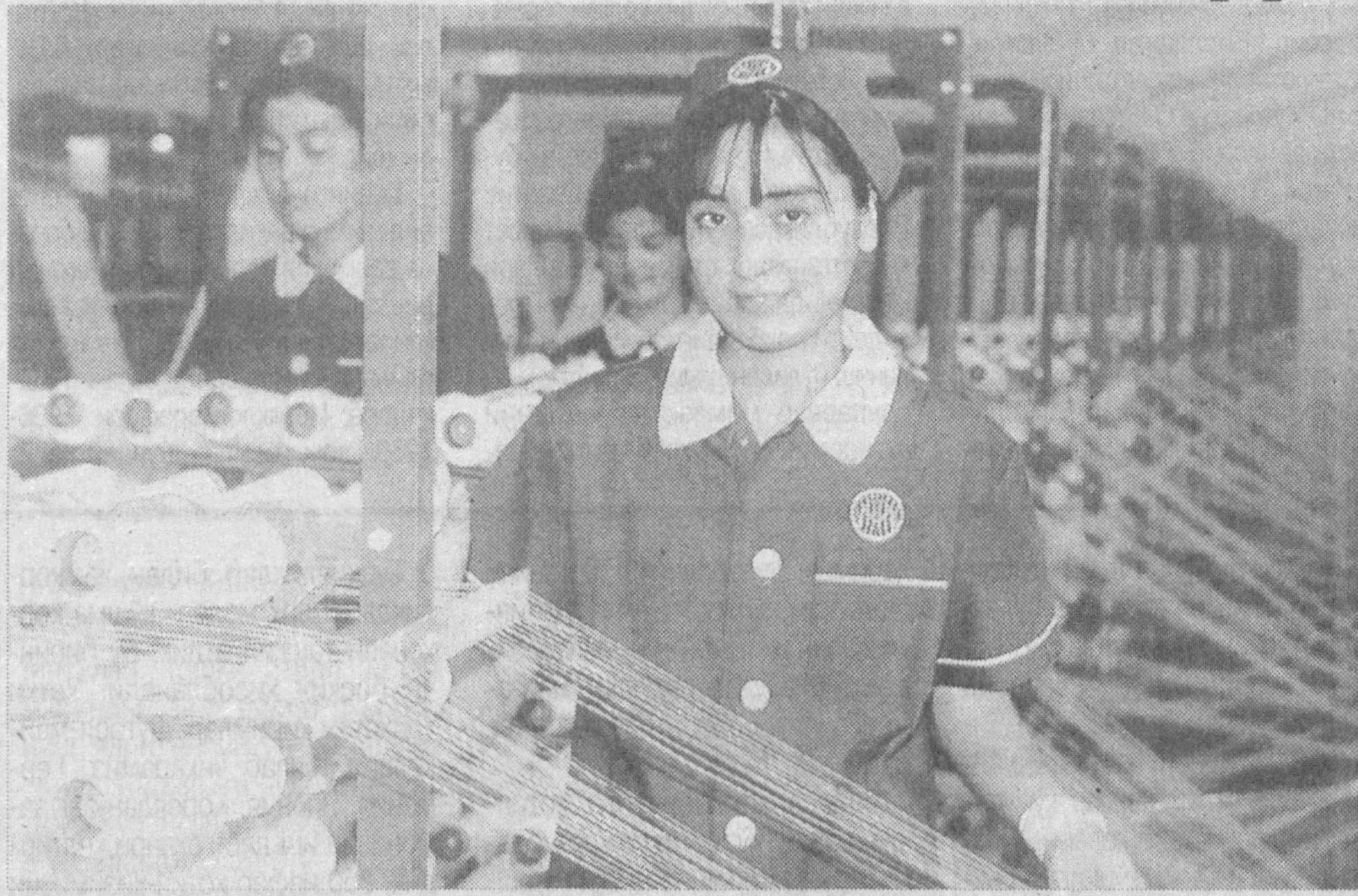
Суратларда: қўшма корхона ҳаётидан лавҳалар.