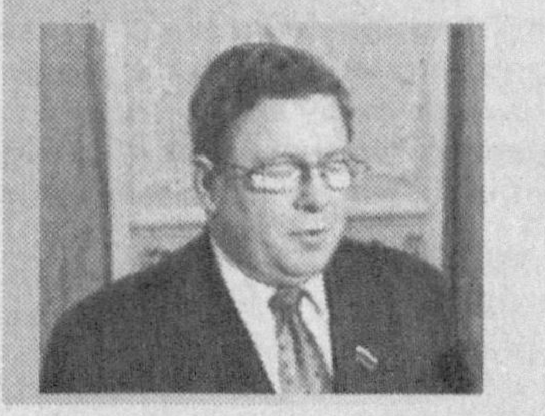
Россия Федерация Кенгаши раисининг ўринбосари Александр Торшин

Бесланадаги террорчилик ҳуружини текшириш юзасидан махсус комиссия иш бошланганини маълум қилди. Сенатор сўзларига қўра, комиссиянинг қаерда жойлашиши ҳозирдаёқ маълум. Комиссия Федерация кенгашининг 20 сентябрда ўтадиган навбатдан ташқари мажлисда тузилади, деб эслатади «Новости» ахборот агентлиги.