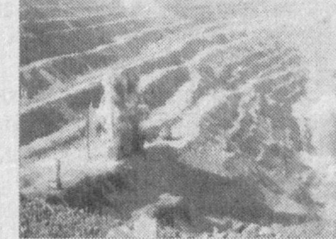
тиқ ходимларимиз бор. Аҳил, кўп миллатли жамоа.