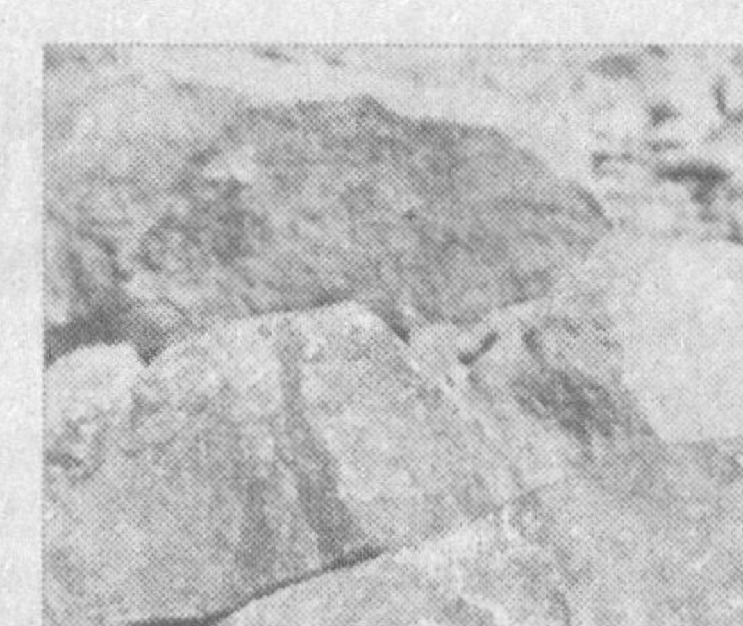
Бир гал Навоий вилоят хокими Бахриддин Рўзиев ҳам худуд геологлари билан бўлган учрашувда шунга яқин сўзлар айтганди.

Хазинатопарлар... Кўз ўнгимизда ер қаъридан турли хил нодир бойликлар топилиб, санатимиз ривожига ўзларининг машаққатли меҳнати билан салмоқли хисса қўшаётган, баъзида юзлари хорғин, заҳматкаш, аммо кўзларида касби-коридан доим масрурилик туйғуларини сезилиб турган мардона кишилар намоев бўлади.