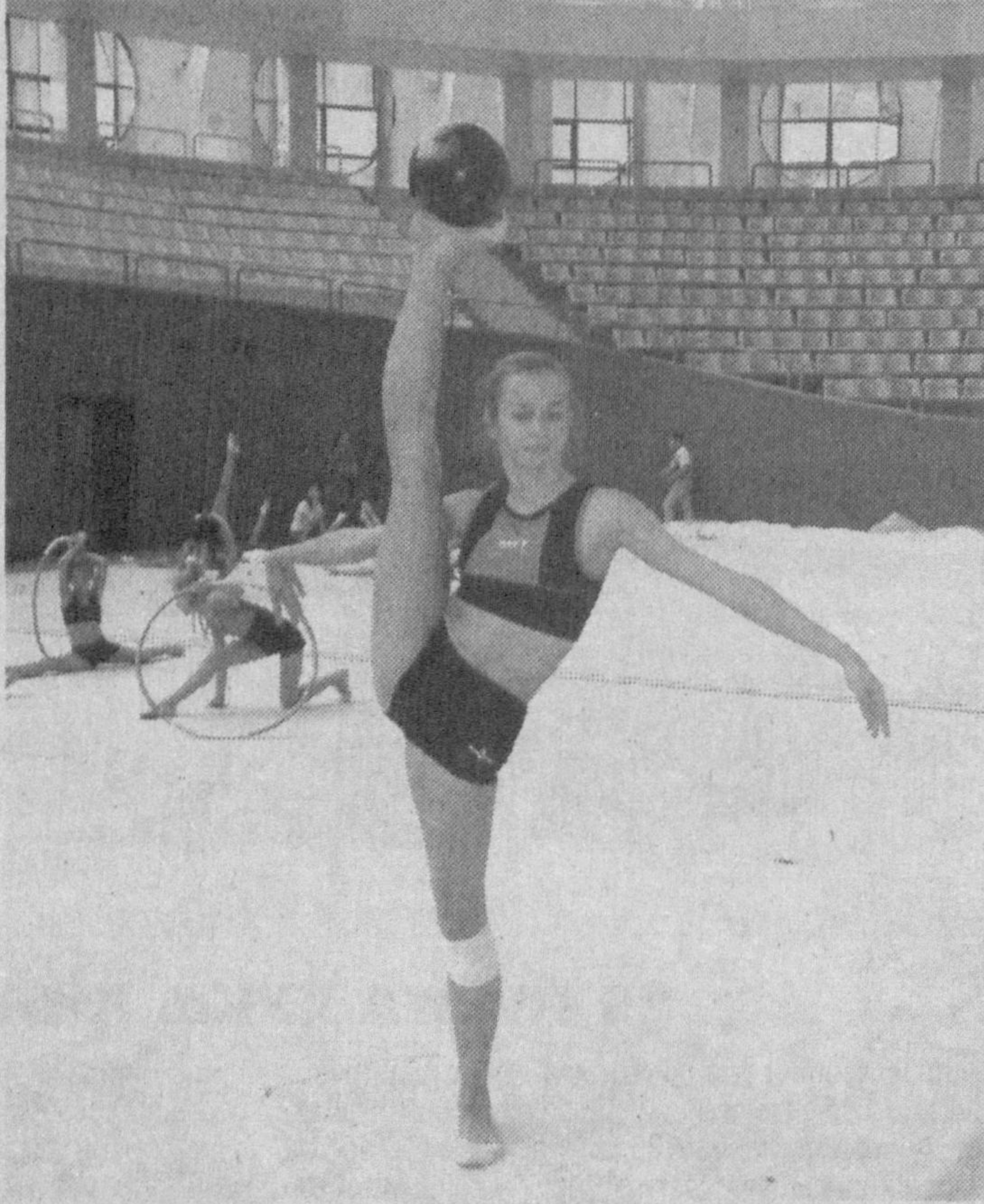
Суратларда: қизларимизнинг мусобақага тайёргарлик жараёнидан лавҳалар.