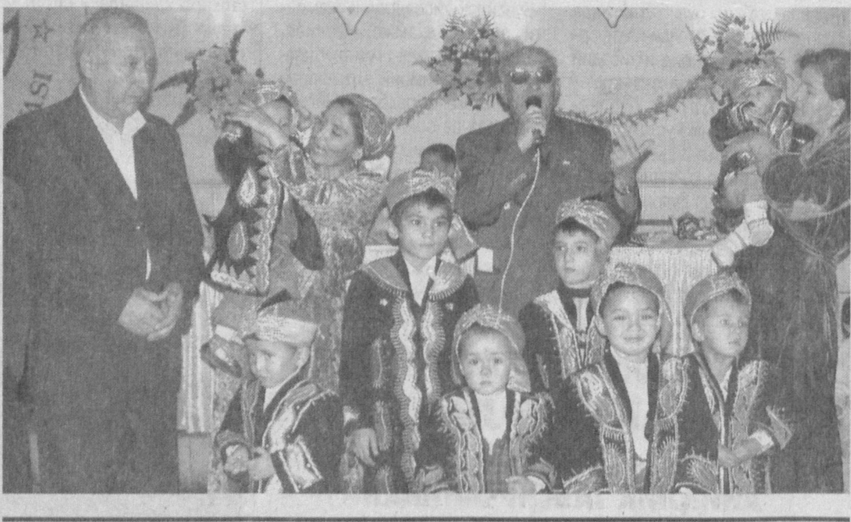
«Пахта — 2004»