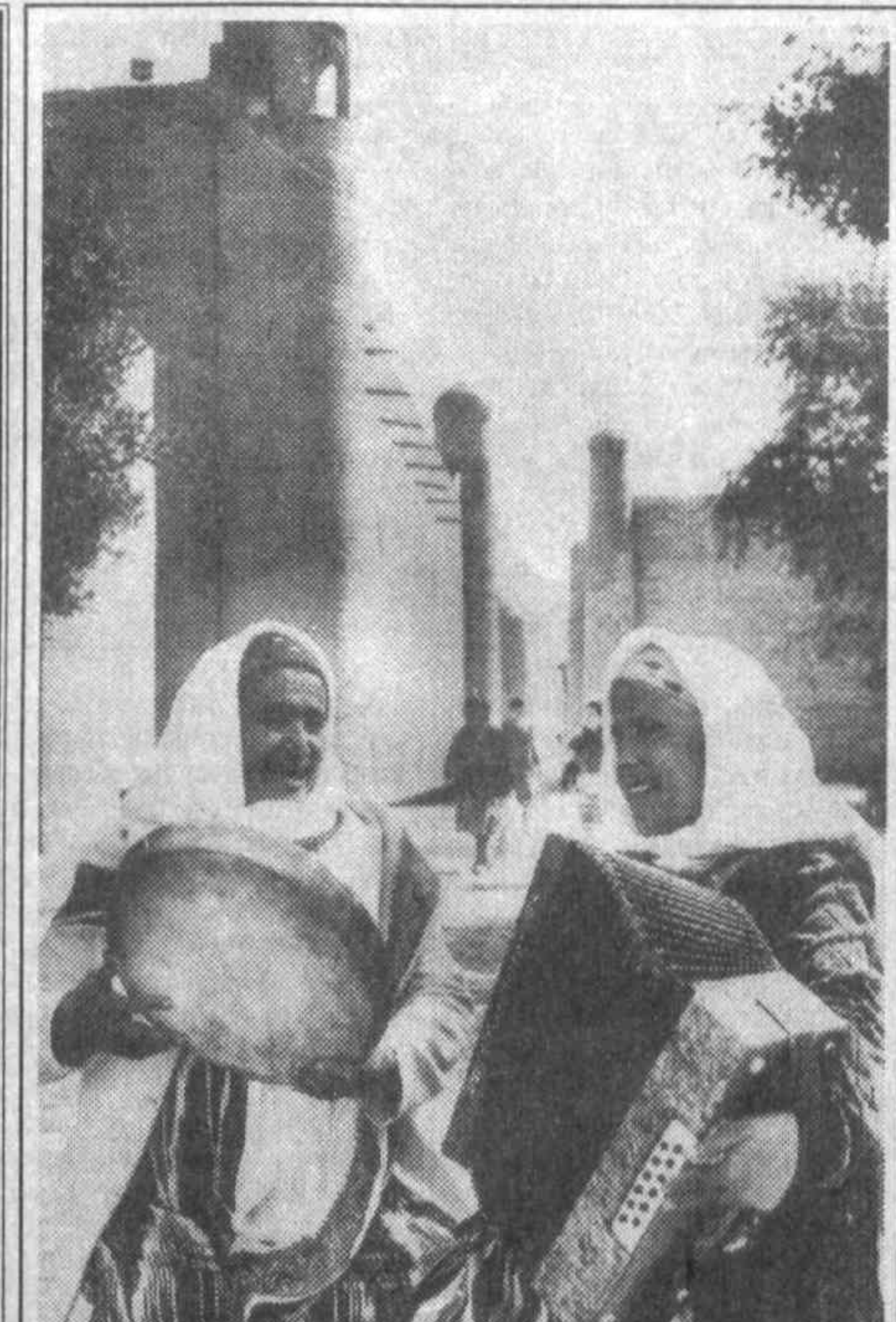
СУРАТДА: Ҳорам халифалари халқ оғзаки ижодини завқу шавқ билан куйлашади.

Бу дунёдан кетар йўлим, ўтар йўлим, Сенинг бирлан бирдир элим, хоксор элим. Бутун умрим меҳру соғинч кўчасидир, Бор ҳаётим бир шеърят кечасидир. Сирояддин САЙИД.