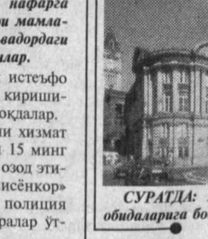
СУРАТДА: Буюк Британия тарихий обидаларига бой мамлакат.

Грузия Мудофиа вазирлиги республика парламентни муқоамасига тақдим қилинди. Лойиҳага мувофиқ Грузия ҳарбий доктринаси мулоффа характерида бўлиб, мамлакатнинг бошқа давлатга қарши ҳарбий иттифоққа кириши таъқиқланади.