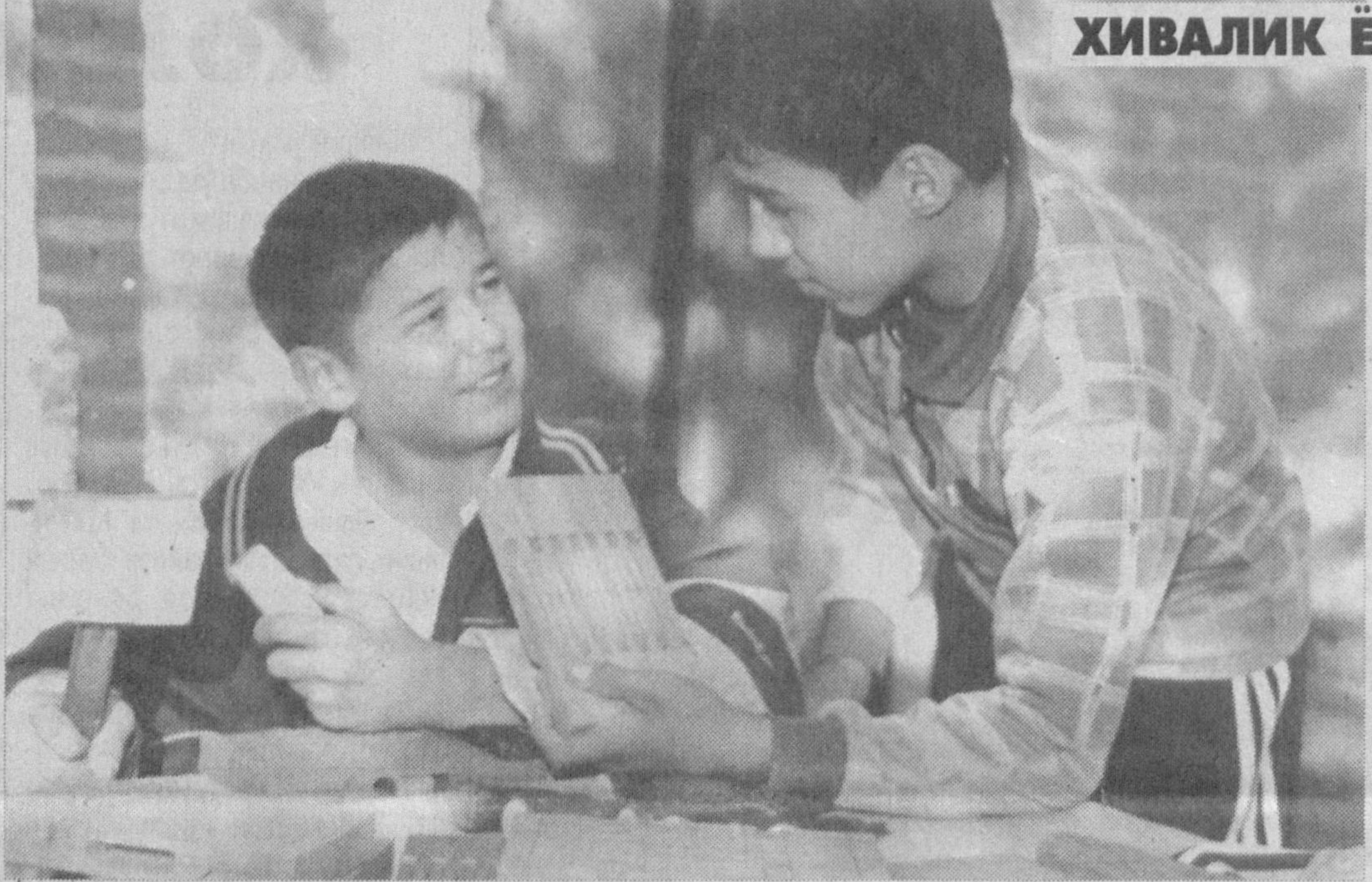
ХИВАЛИК ЁШ ҲАМКАРЛАР

Хива шаҳар хунарманчилик уюшмасига қарашли Ичан Қалъа қўриқонасида жойлашган ёғоч йўмакорлиги цехида эшик, устун, дераза, стол-стуллар, шунингдек, ёғочдан ясалган сувенир ҳамда уй-рўзгор буюмлари ишлаб чиқарилаётган. Йўмакорлик цехида тажрибали устозлар 50 нафар ёша хунарманчилик уюшмасига қарашли Ичан Қалъа қўриқонасида жойлашган ёғоч йўмакорлиги цехида эшик, устун, дераза, стол-стуллар, шунингдек, ёғочдан ясалган сувенир ҳамда уй-рўзгор буюмлари ишлаб чиқарилаётган. Йўмакорлик цехида тажрибали устозлар 50 нафар ёша хунарманчилик уюшмасига қарашли Ичан Қалъа қўриқонасида жойлашган ёғоч йўмакорлиги цехида эшик, устун, дераза, стол-стуллар, шунингдек, ёғочдан ясалган сувенир ҳамда уй-рўзгор буюмлари ишлаб чиқарилаётган.