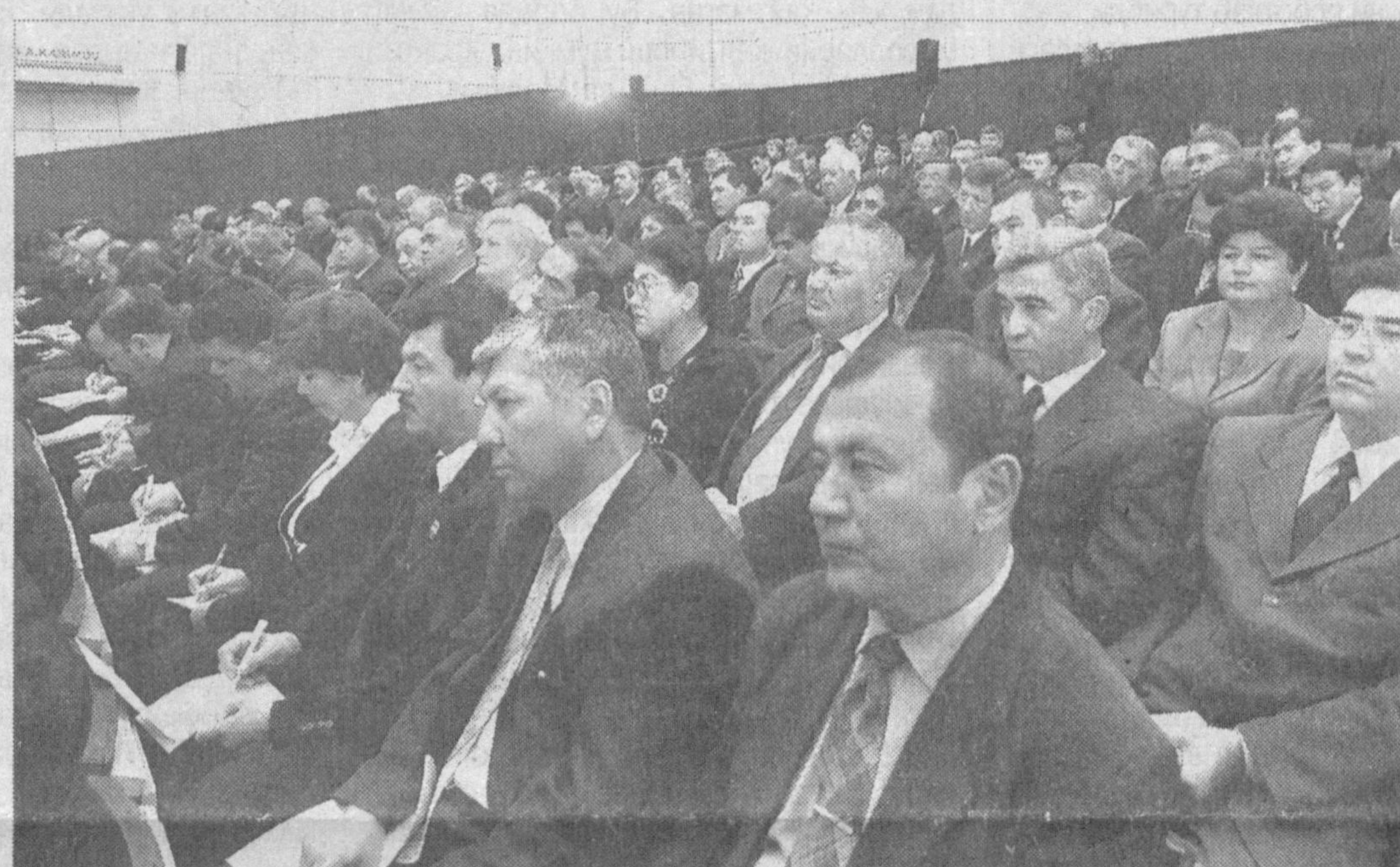
ПРЕЗИДЕНТ ИСЛОМ КАРИМОВНИНГ ХАЛҚ ДЕПУТАТЛАРИ СИРДАРЁ ВИЛОЯТИ КЕНГАШИНИНГ НАВБАТДАН ТАШҚАРИ СЕССИЯСИДАГИ НУТҚИ БАЁНИ