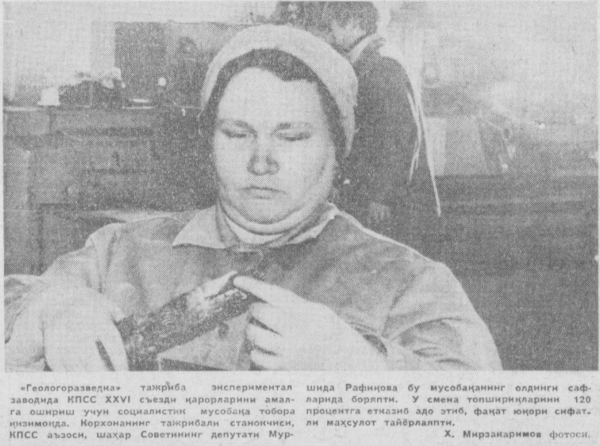
«Геологоразведка» таъриба экспериментал заводида КПСС XXVI съезди қарорларини амалга ошириш учун социалистик мусобақа тобора яхшиланаётган. Корхонанинг таъриба лабораторияси, КПСС аъзоси, шаҳар Советининг депутаты Мур

Ишчилар айни пайтда кенг қулоч ёйган «СССРнинг 60 йиллигига» — 60 зарбдор ҳафта» ҳаракатида ҳам актив иштирок этмоқ