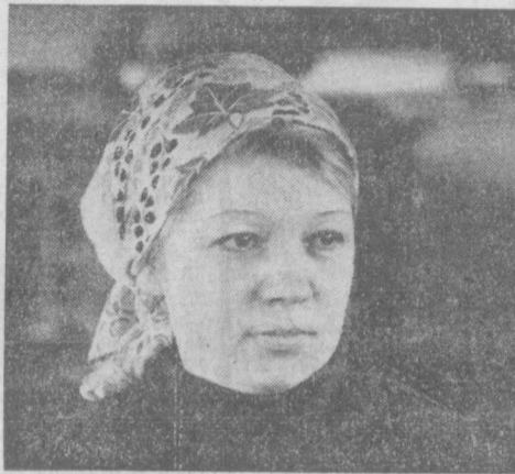
Шахримдаги «Компрессор» заводининг коллектив ўтган йилнинг IV квартал ишлари бўйича Химия ва нефть машинасозлиги министрига ҳамда оғир машинасозлик ишчилари насаба сўзми Марказий Комитетининг кўмаги Қизил байроғига сазовор бўлди. Завод махсулотларини мамлакатимиз-

— Мана партиямиз XXVI съезди ўз ишчи бошлангичида бир йил тулади. Съезд тузаб берган жуда натижа буювдорлик программасини амалга оширишга корхонамиз инженер-техник ходимлари, ишчи хизматчилари ҳам фаълиятини муносиб ҳиссаларини қўшилди. Агар ўзини беш йилликда пахтакорлар учун 43 мингдан зиёд терим машиналари тайёрлаб берилган бўлса, янги беш йилликдаги режа бундан ҳам юксакроқдир. Йил сайин, ой сайин эришишга йўл кўрсатиш сабаблари нимада? Энг аввало ишчи айтиш керакин, коммунистлар съезд қарорларини амалга оширишда ташаббускорлик ва юксак илтимос намоналарини кўрсатмоқдалар. Шу ўринда 15-сех токар-