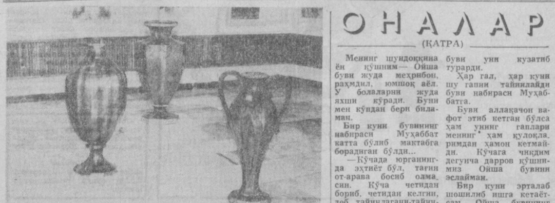
Шахримиздаги Ўзбекистон ССР Рассомлар союзининг кўргазмалар элида намойиш қилинган республика хаваскор рассомлари асарлари...