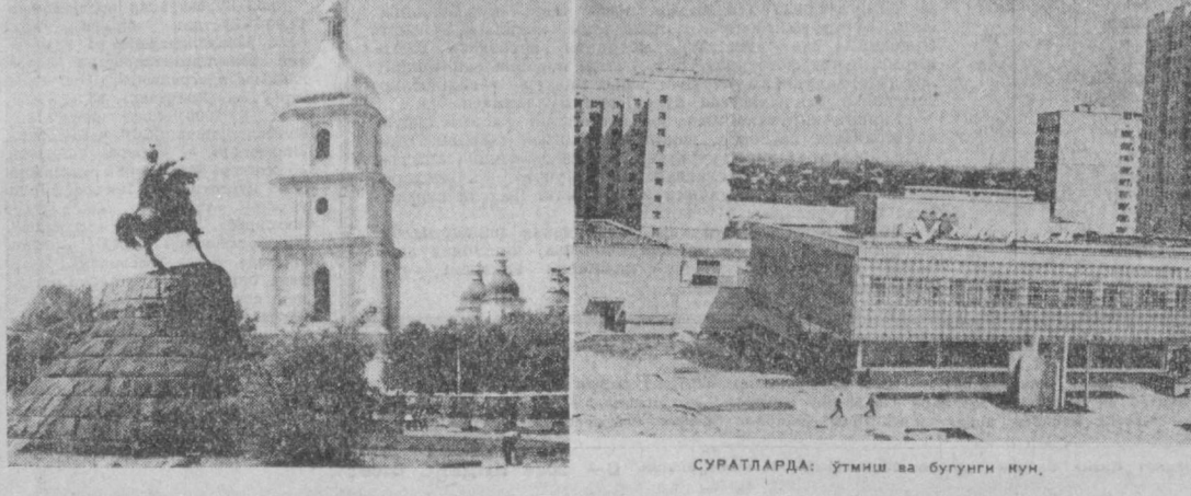
СУРАТЛАРДА: ўтмиш ва бугунги КИМ.

Украина пойтахти-нинг ҳар бир киши-си ҳисобига 280 квадрат метр кўкаламзор тў-ғри келади. Киев Евро-падаги энг кўкаламзор шаҳар ҳисобланади. Киевда 2,5 миян майдон, хибон, кўча