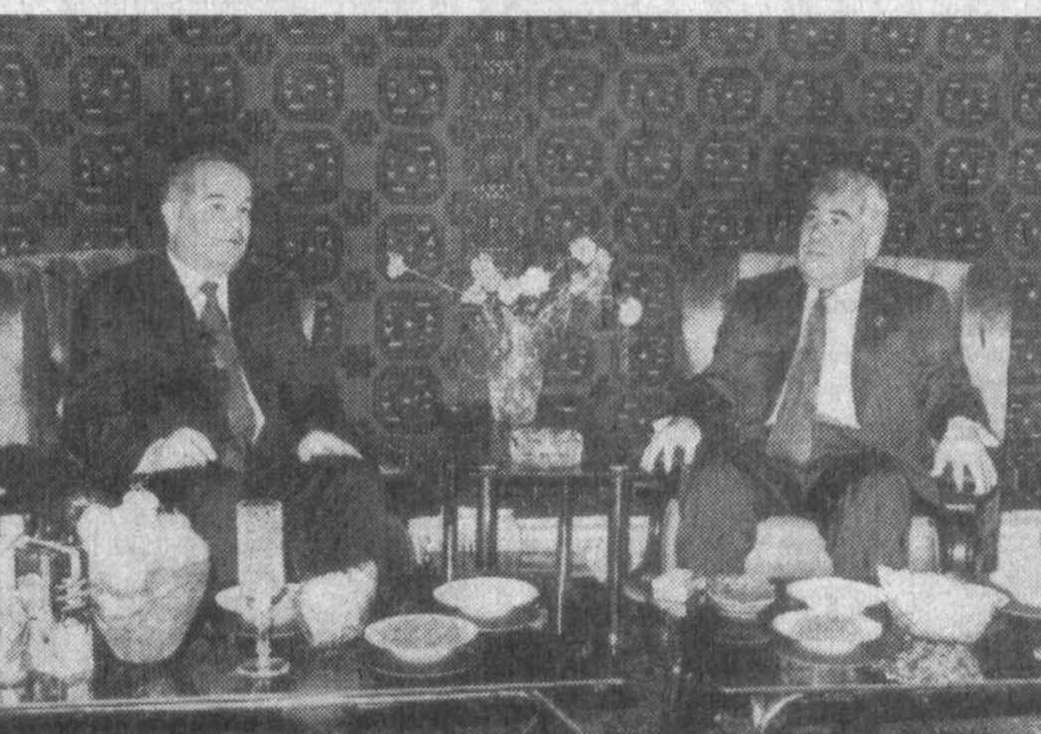
Ўзбекистон Президентини Ислам Каримов ва Туркманистон Президентини Сапармурод Ниёзовни олқишлаш учун кўчаларга чиқдилар.

Авалло, ташриф биродарларий дийдорлашувига хос гоғят кўтаринки руҳда ўтганини кайд этиш жоиз. Юртимиз билан жон қўшни билан минглаб чоржўйликлар Ўзбекистон Президентини Ислом Каримов ва Туркманистон Президентини Сапармурод Ниёзовни олқишлаш учун кўчаларга чиқдилар. Улар Президентларнинг икки мамлакат ўртасидаги муносабатларни мустаҳкамлаш борасида амалга ошираётган ишларини қўлаб-қувватлашга қила-