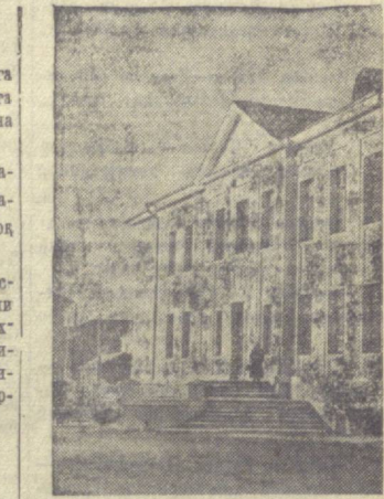
Дрославль. Бу йил автомобиль заводининг ишчилари ва хизматчилари учун неча ўнлаб янги уйлар қурилди. Последкининг марказида еттибиллик мактаб биноси қурилди. Суратда: Еттибиллик мактабининг янги биноси.

ЛЕНИНГРАД, 17 март. (ТАСС). Ленинграддаги мева комбинати лабораториясида ультрафиолет нурлар ёрдами билан цитрус меваларини узоқ вақт сақлаш усули таъриб қилиб кўрилди. Таъриб қилиб кўриш учун асобоб тайёрланди. Бу асобоб қисман иборат. Биринчи қисмида меваларга нур сочладиган, иккинчи қисмида еса мевалар нур сингирилган тоза қоргоға ўрланди. Микробиология соҳасида ўтказилган текширишлар 30 кун мобайнида ультрафиолет нурлар сингирилган цитрус мевалари ера моғаламай жуда яхши сақланганини кўрсатди.