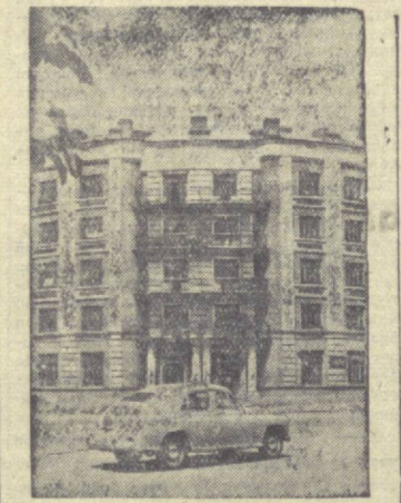
Суратда: Шимолий Осетия АССРнинг пойтахти Дзуджиковадаги металлургия заводи ишчилари учун қурилган янги бино.

Урта Осиё ҳалқларининг қўниға достоинлари қабил бу достон ҳам ҳалқнинг аюлмларга қарши олиб берган қаҳрамонона курашини асқ етилади. Достондаги асосий қаҳрамонларнинг образлари ҳалқнинг мардани, сабот-матонятини, ўз юртига муҳаббатини тасвир етди. Достон рус тилига тўла таржима қилиб чиқарилди. (ТАСС).