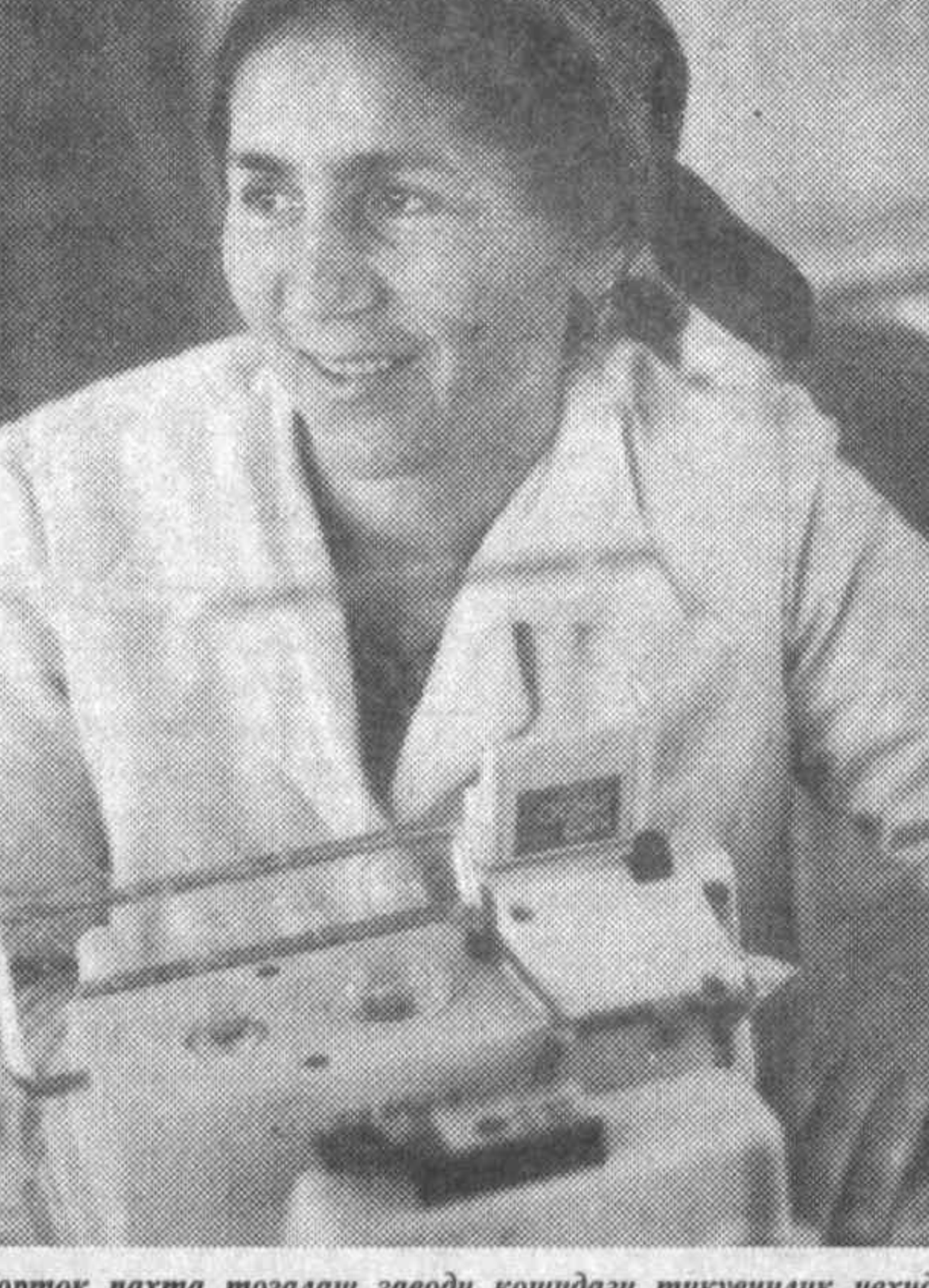
Чортоқ нахша тозалаш заводи қўшиқдаги тўқувчилик ҳисоби тиклаётган болалар, аёллар ва эркаклар кийимлари сифатлигини учун қўчмаликка маъмур бўлмоқда.

Юқорида айтилганидек, буюк бобокалонимиз таваллуд тўйи бутун дунёда кенг нишонланади.