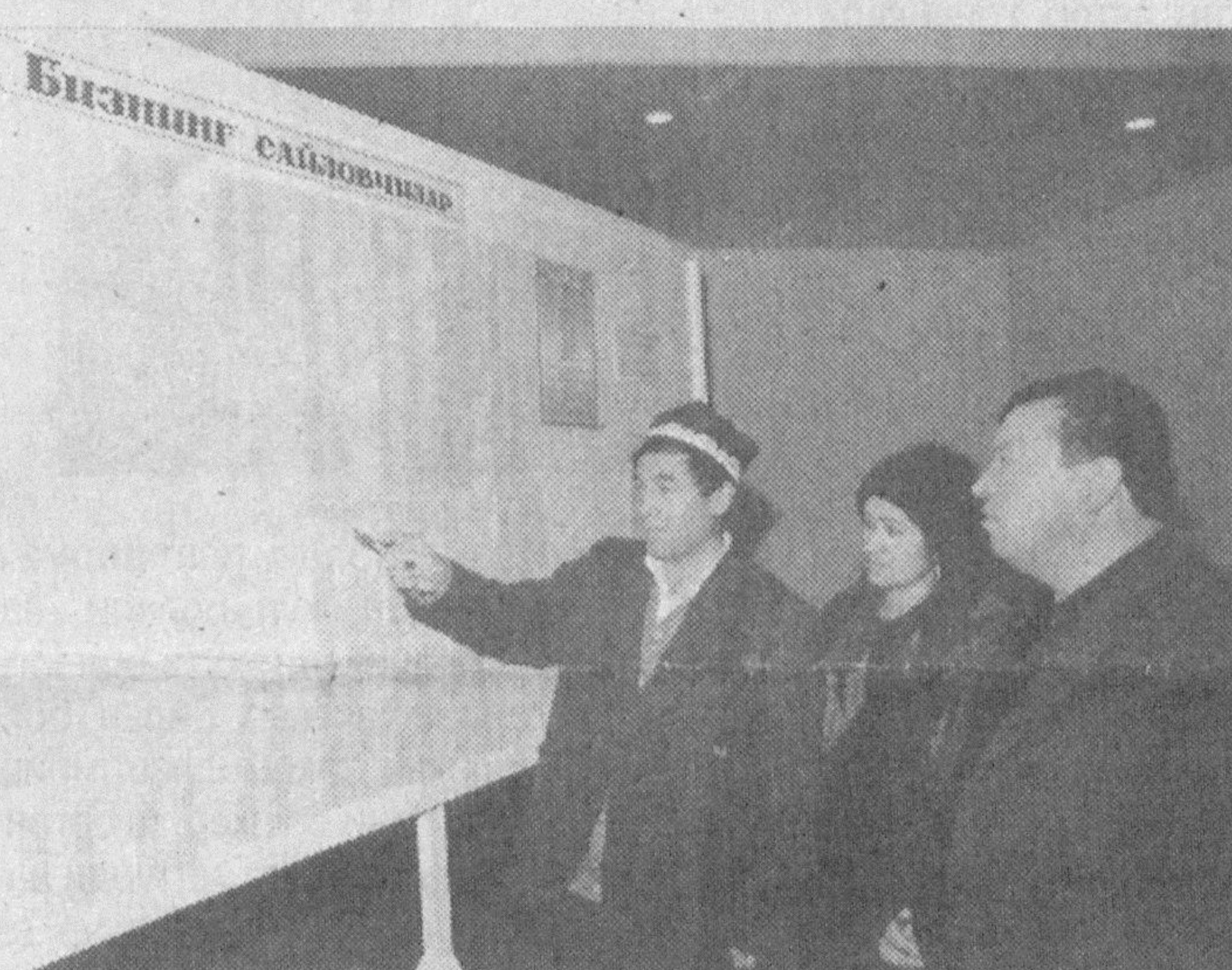
Суратларда: Қўрғонтепа сайлов округи 562-сайлов участкаси фаолиятидан лавҳалар.

Бу ерда сайловчиларнинг ўзлари истаган номзодларига овоз беришлари учун барча қулайлик яратилган.