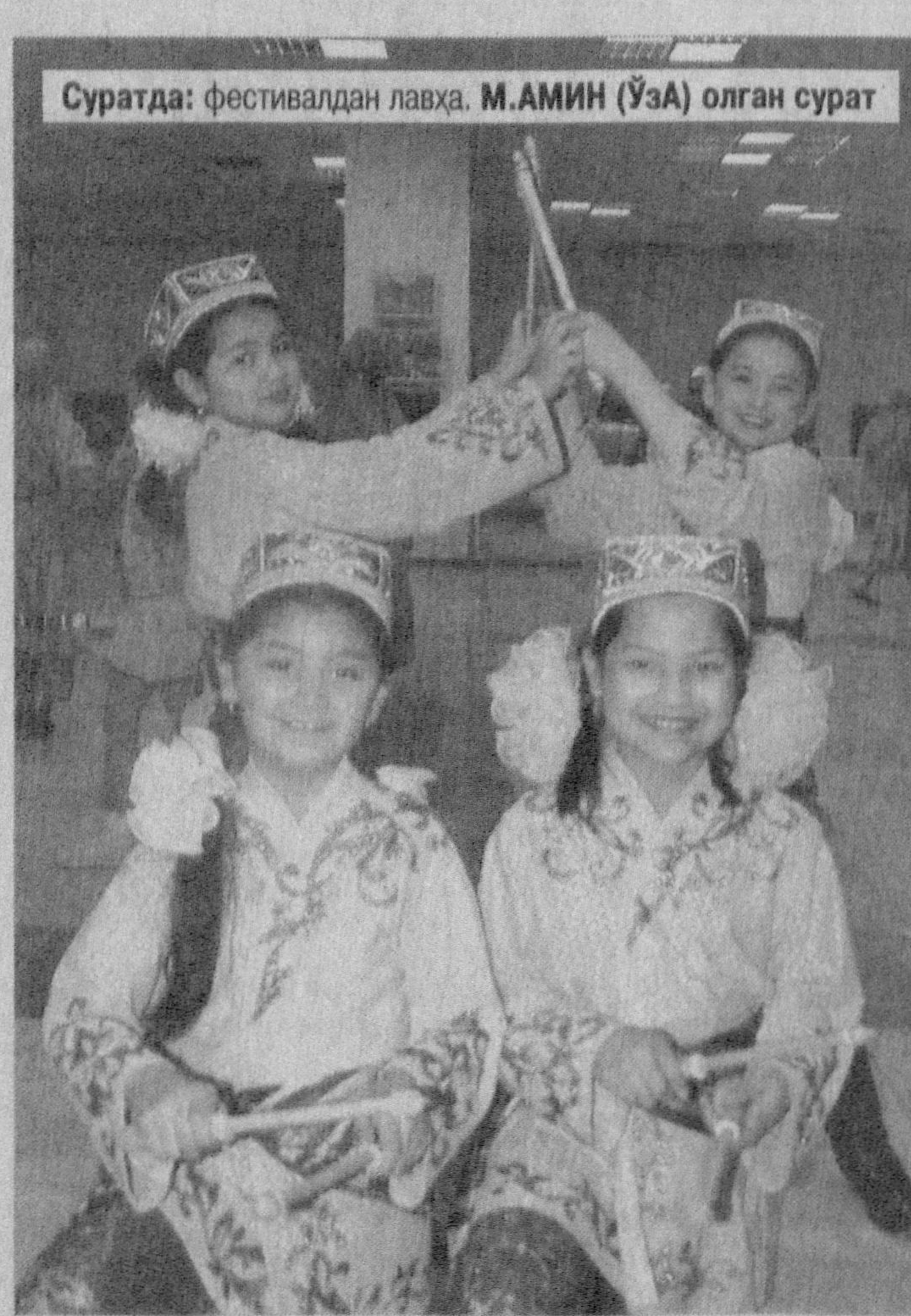
Суратда: фестивалдан лавҳа.