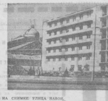
НА СНИМКЕ УЛИЦА НАВОН.