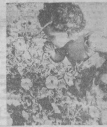
— Душистый табак? — удивляется девушка. — А ну-ка, дай понюхай! Что-то уж очень непохожи эти цветы на табак...