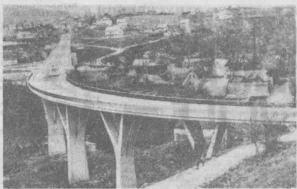
СФРЮ. В нынешнем году заканчивается строительство 500-километровой автомагистрали...