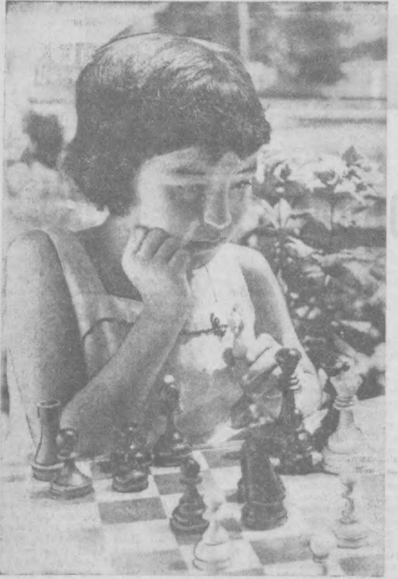
ЮНАЯ ШАХМАТНИЦА.