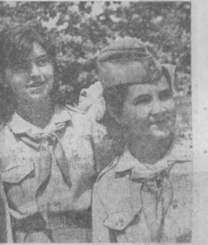
НА СНИМКЕ: учащиеся ташкентских школ, участвовавшие во Всесоюзном пионерском слете.