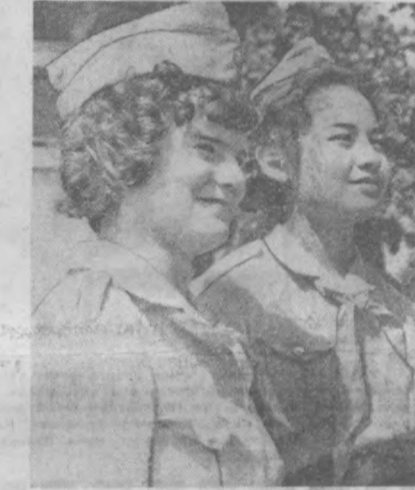
НА СНИМКЕ: учащиеся ташкентских школ, участвовавшие во Всесоюзном пионерском слете.

Если говорить о педагогических кадрах, то прежде всего отродно отметить, что около половины занесены на страницы «Золотой книги» Министерства просвещения Узбекской ССР.