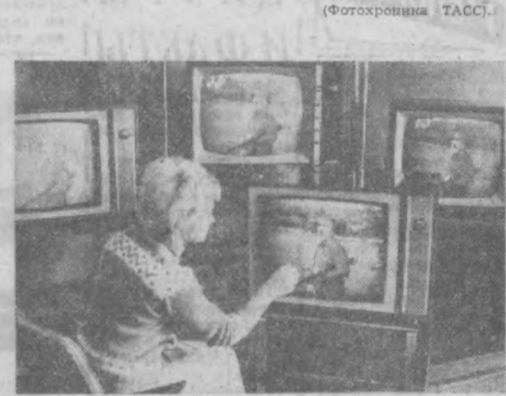
НА СНИМКЕ: в испытательном зале, где происходит проверка цветных телевизионных приемников «Рубин-401».