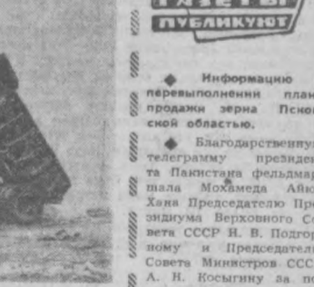
В ИЮНЕ виллойская ГЭС должна дать городам и поселкам алмазного края промышленный ток — будет пущен первый агрегат. НА СНИМКЕ: строительство ГЭС.