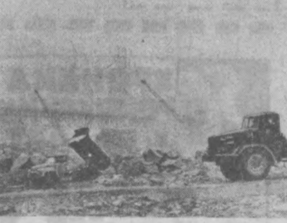
В ИЮНЕ виллойская ГЭС должна дать городам и поселкам алмазного края промышленный ток — будет пущен первый агрегат. НА СНИМКЕ: строительство ГЭС.

О ЧЕРЕДНОМ партии запасных частей к компрессорам «КС-9» отправил в Афганистан завод «Компрессор», продукция которого широко известна за пределами нашей страны. Только в нынешнем году у предприятия купили 69 машин «ПК-10» в тропическом и обычном исполнении, а также много запасных частей к компрессорам разных марок девять зарубежных государств Европы, Азии и Африки.