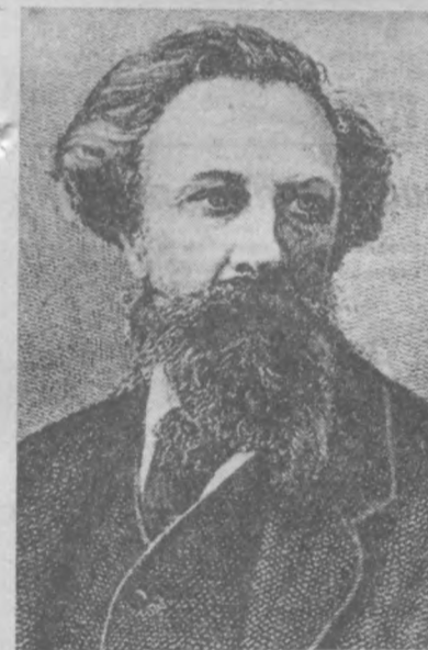
А. К. ТОЛСТОЙ

5 сентября исполняется 150 лет со дня рождения (1817) выдающегося русского писателя Алексея Константиновича Толстого. В его произведениях — историческом романе «Князь Серебряный» и драматической трилогии «Смерть Иоанна Грозного», «Царь Федор Иоаннович», «Царь Борис» — изображены политическая борьба и русский быт конца XVI — начала XVII веков. А. К. Толстой был автором многих лирических стихотворений, многие из них были положены на музыку известными русскими композиторами.