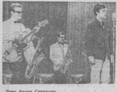
Поэт Карел Сколаци.