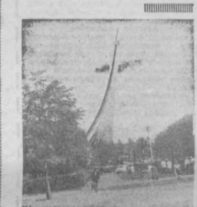
НА ВДНХ СССР