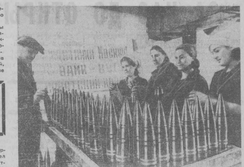
Тыл — фронту. На одном из заводов в те дни.