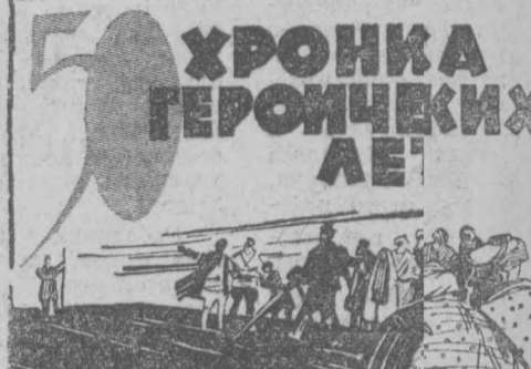
ХРОНИКА ГЕРОИЧЕСКИХ ДЕЛ